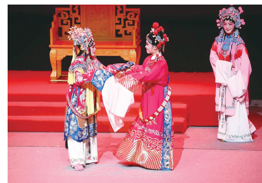
《女驸马》在神农大剧院演出。