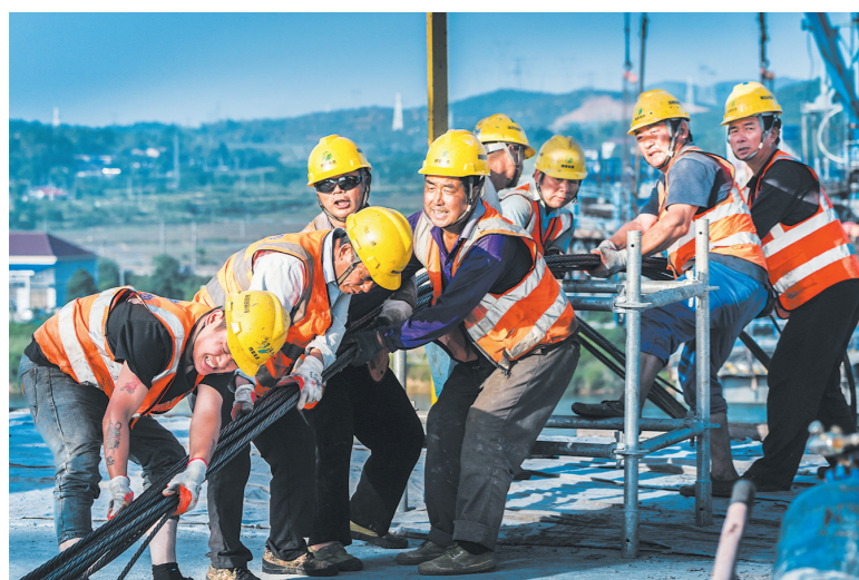
工人们在合力拉动钢索。