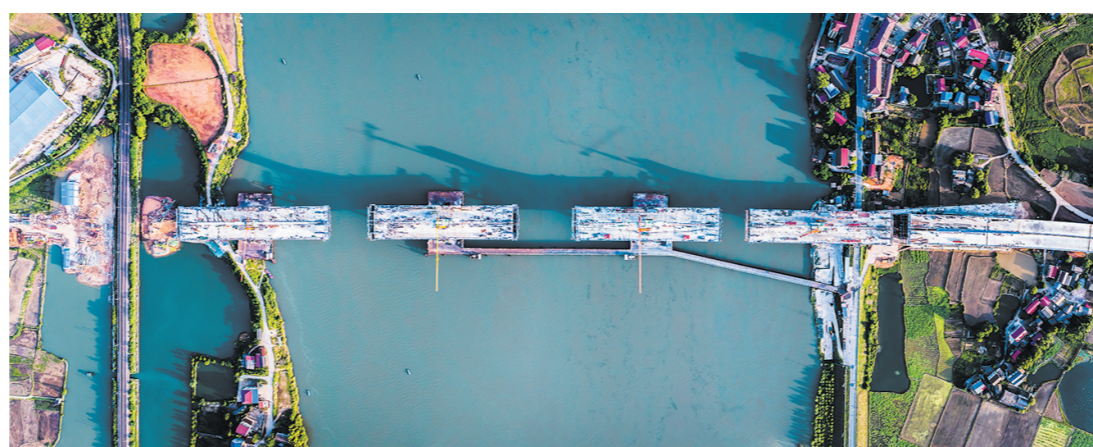
横跨湘江的四座桥墩。

主墩均已全部进入上构悬浇阶段, 有望在2024年10月初实现合龙。现在, 已完成工程总量的80%, 预计2024年12月建成通车。醴娄高速湘江特大桥所属的G60醴陵至娄底高速公路扩容工程是交通运输部国高网“十三五”规划项目。特大桥的建成通车, 将极大缓解沪昆高速株洲、湘潭、娄底段的通行压力, 同时也将带动醴陵市、天元区、渌口区的经济发展。