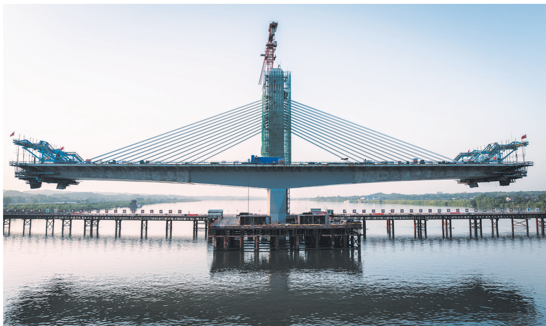
耸立在江心的大桥主桥墩。

醴娄高速湘江特大桥是上海至昆明国家高速公路醴陵至娄底段扩容工程项目, 位于我市渌口区南洲镇荷塘村和天元区三门镇苍霞村之间, 横跨湘江。大桥处于湘江株洲航电枢纽上游, 江面宽、江水深。项目总长1998米, 桥型为混凝土预应力四塔五跨矮塔斜拉桥。桥梁总长1658米, 桥面宽39.5米, 主桥长892.5米, 引桥765.5米, 路基长340米。2022年8月, 醴娄高速株