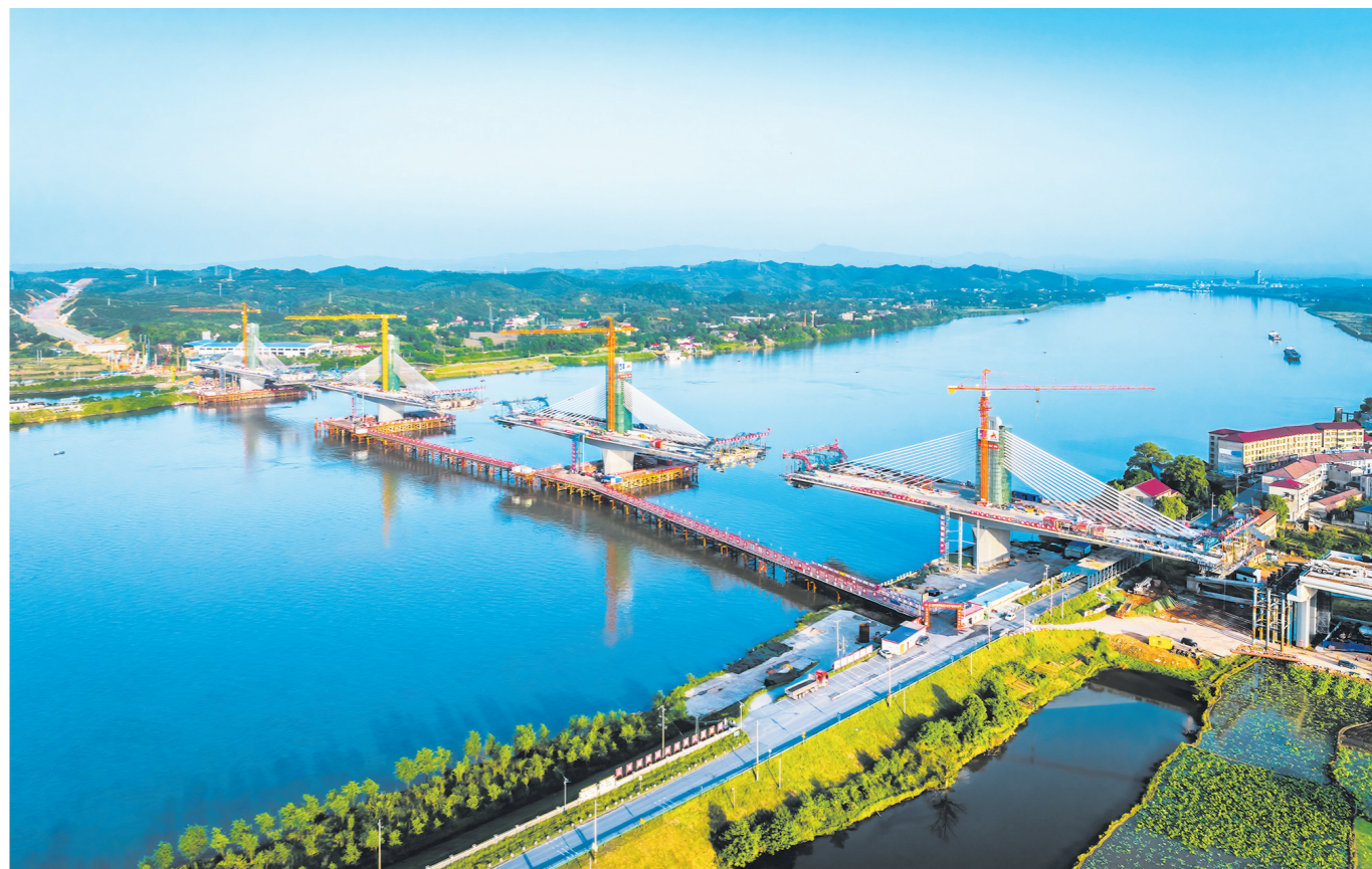
建设中的醴娄高速株洲湘江特大桥。