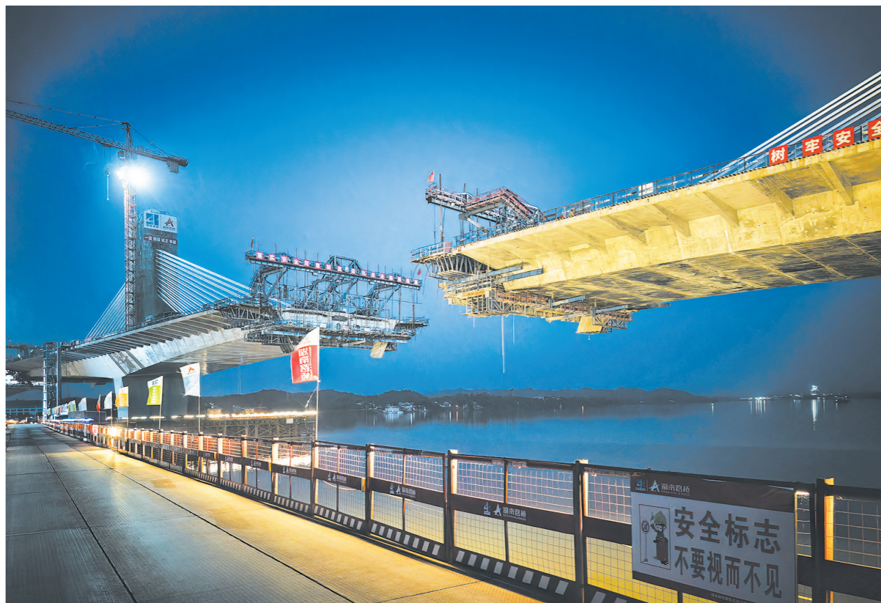
夜幕里的湘江特大桥工地。