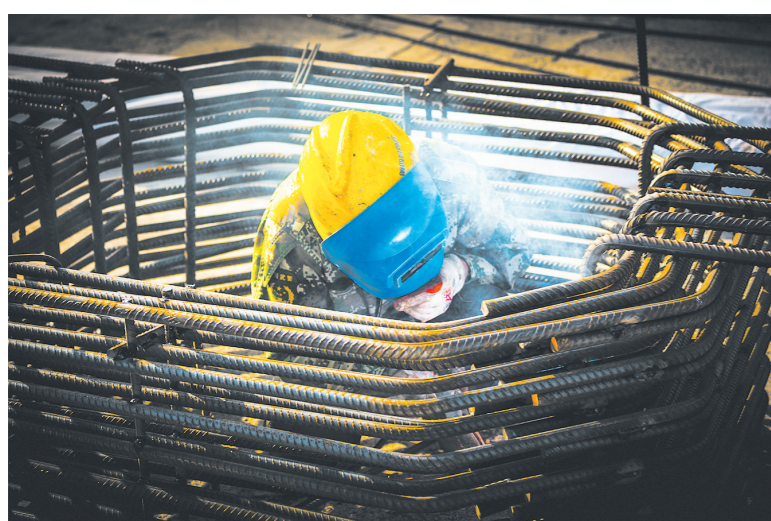
工人在埋头焊接混凝土构件。