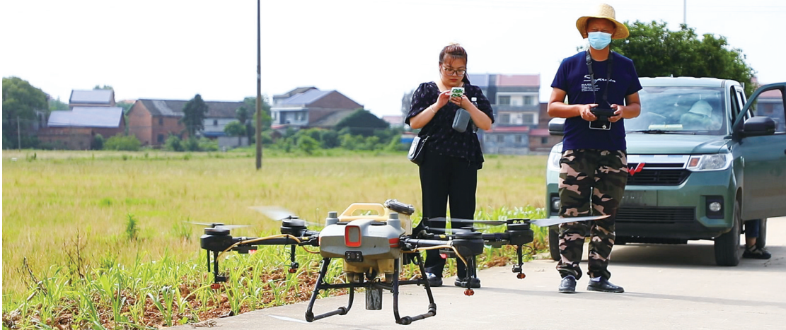
技术人员操作无人机开展飞防作业。

近年来,该县大力推广飞机播种、无人施肥、无人机病虫害防治以及机械化收割等科技化手段,不断强化科技兴农措施,以现代化科技助力农业生产、帮助农民增收增收,为乡村振兴提供有力支撑。