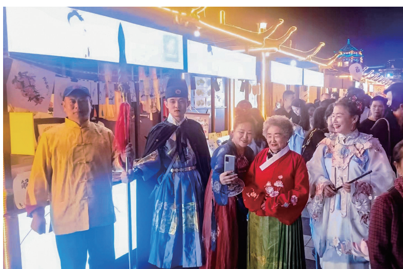
着古装,穿越在宋朝风情街。