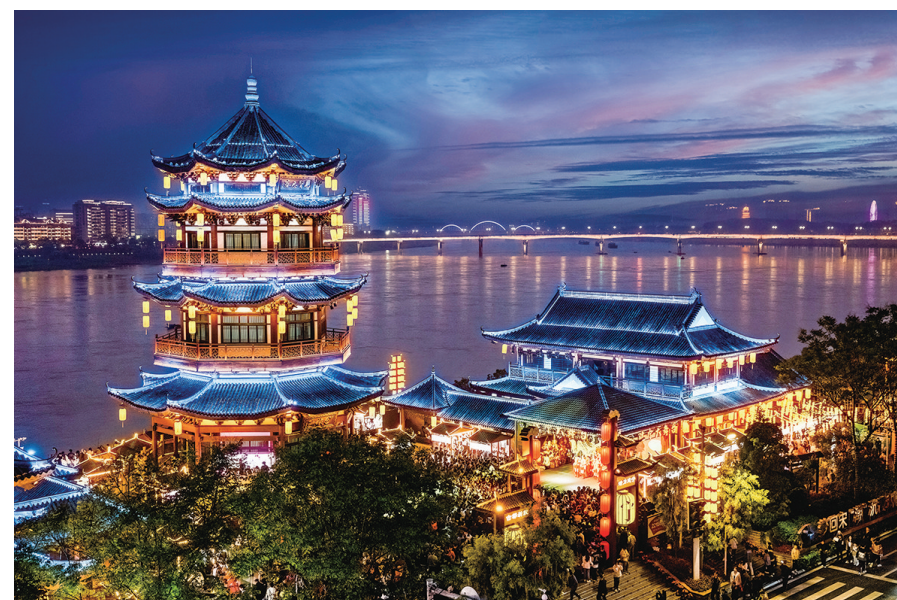
临江而立的分袂亭,晶莹灵动。