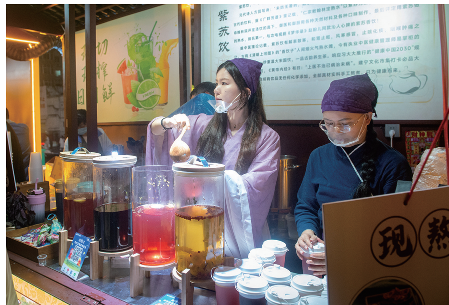
不少摊主身着宋代古装,颇有趣。