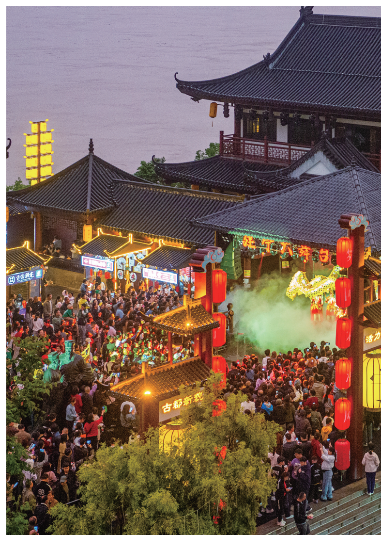
建宁大舞台,被热情的观众围得水泄不通。

身着国风服饰,漫步温婉湘江,吹和煦清风,闻扑鼻花香,品人间烟火,看月色晚星。建宁市集,临江等你。