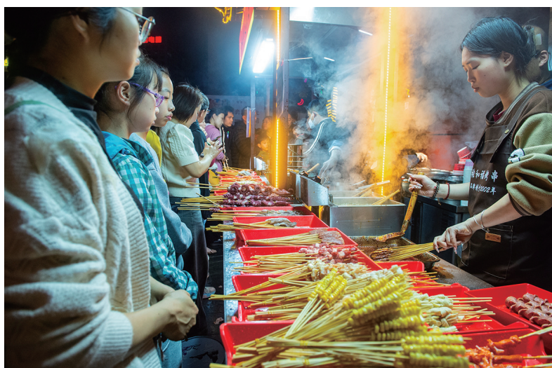
食物的烟火气是集市的标志之一。