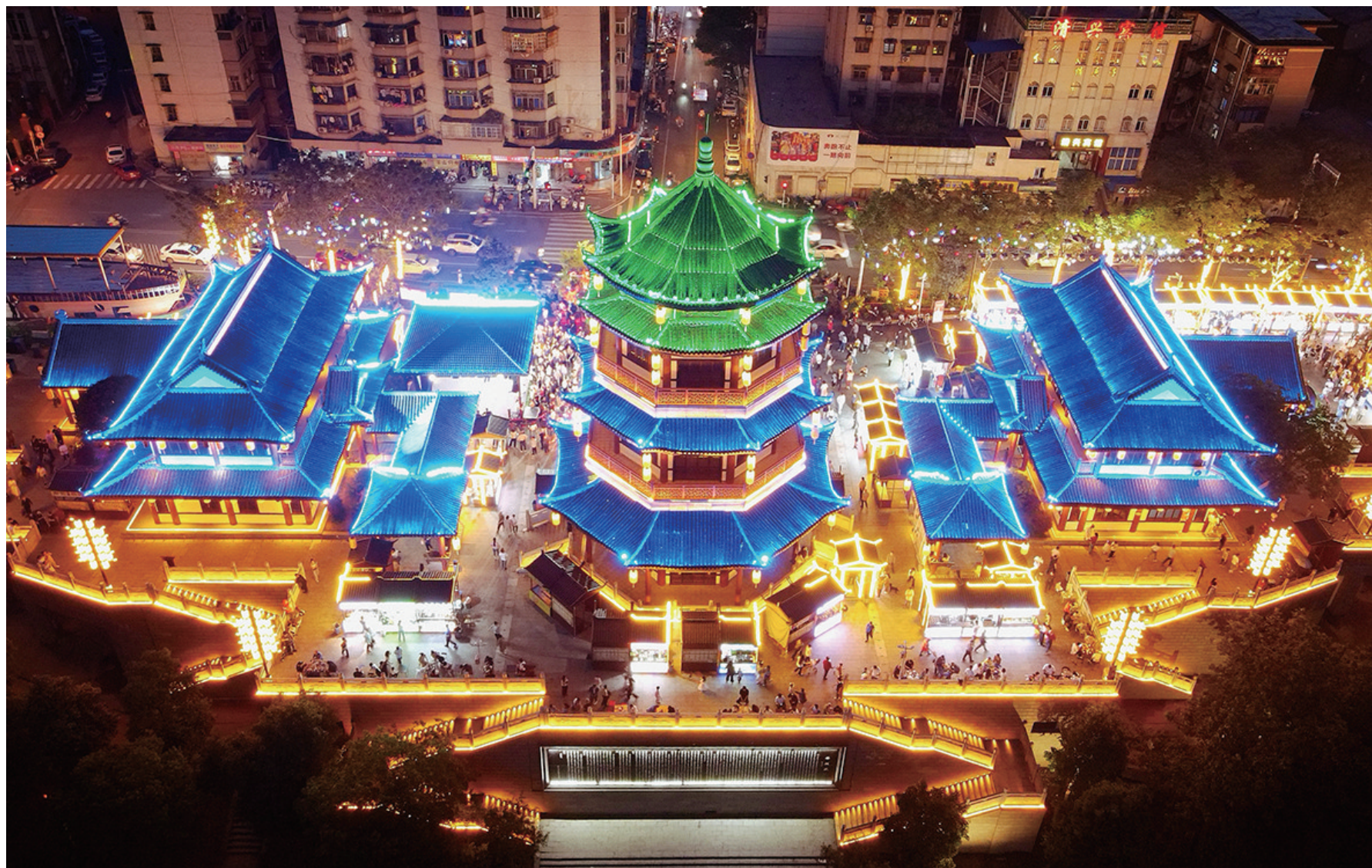
分袂亭动态灯光秀让建宁市独树一帜。