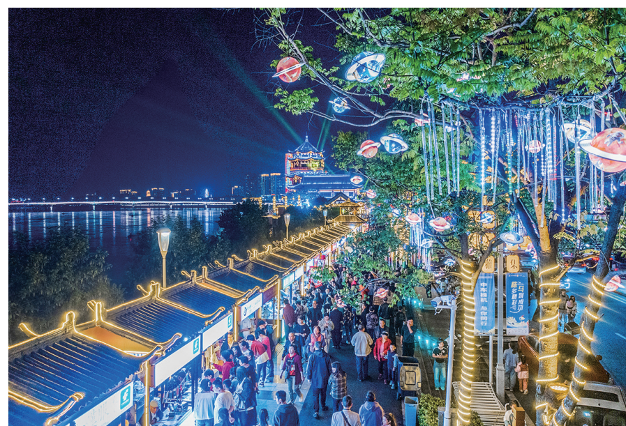
市集以分袂亭为中心向南北延伸,设置摊位128个。