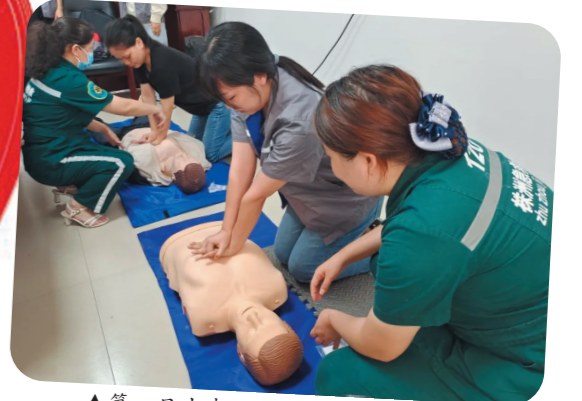
▲第一目击者培训现场。

在市人民医院,也有这样一群可爱的“提灯者”,她们以此为座右铭,全情护理,精益求精,把满腔热情献给了护理事业,用“爱心、细心、责任心”浇注卓越护理品牌,赢得无数患者和家属的赞誉。