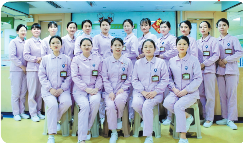
▲心血管内科护理团队。