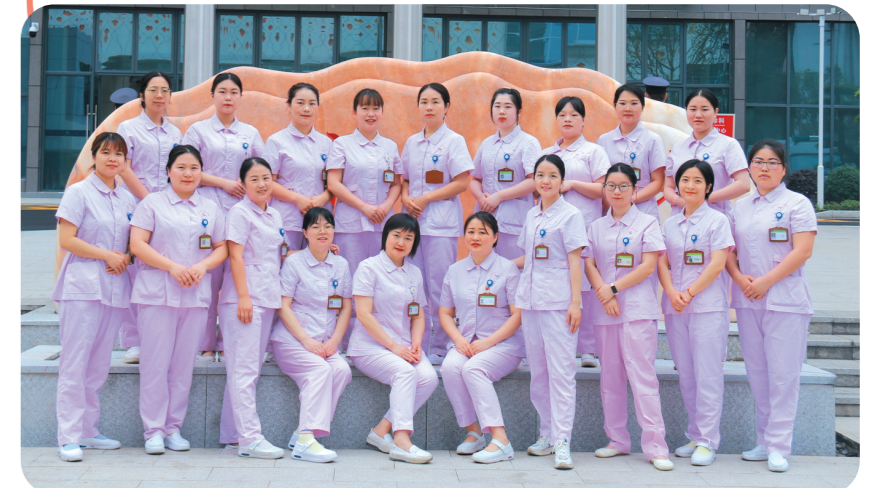
▲急诊科护理团队。