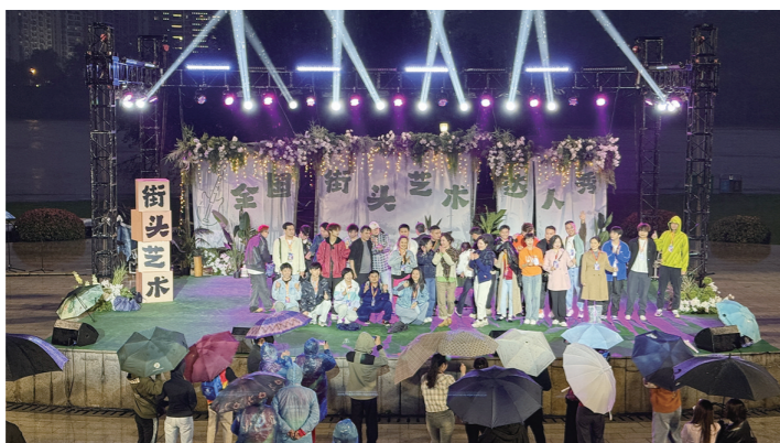
全国街头艺术达人秀吸引全国街头艺人来株演出。