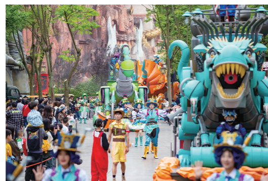
株洲方特旅游景区推出次元盛典吸引众多游客前来。