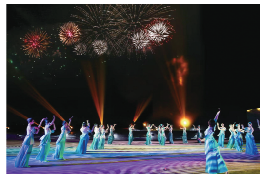
《国彩醴陵》精彩上演。