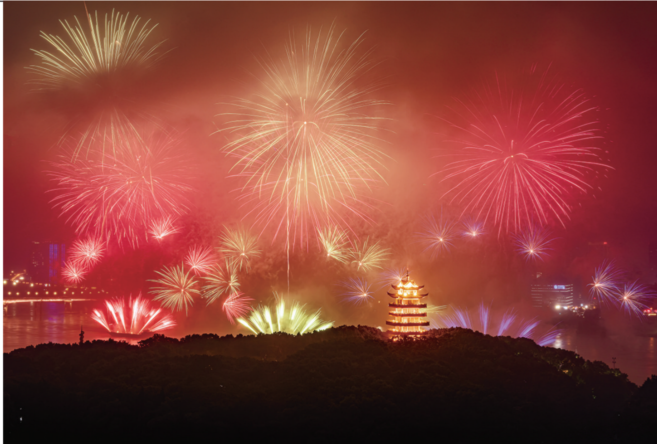
5月3日晚，制造名城烟花秀吸引市民和游客驻足观看。