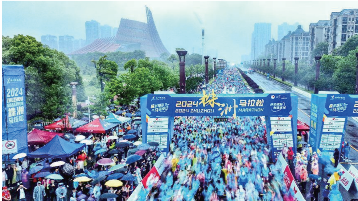
5月4日，2024株洲马拉松隆重举行。