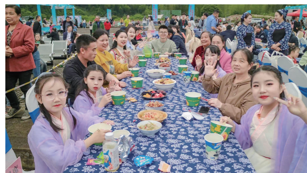
神农谷第二届民俗文化节民俗风情体验。