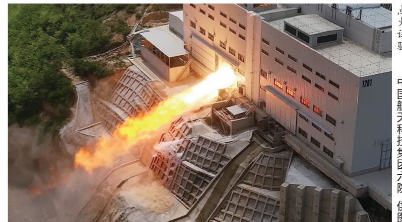
由中国航天科技集团六院自主研发的130吨级液氧煤油发动机四机并联点火试验圆满成功。

据新华社北京4月28日电 记者从中国航天科技集团有限公司获悉,4月28日,由中国航天科技集团六院自主研发的130吨级液氧煤油发动机四机并联点火试验,发动机总推力超500吨,这是我国液体动力发展史上推力最大、系统最为复杂的一次发动机点火试验,是首次大推力液氧煤油发动机四机并联点火试验,对四机并联方案进行了“全面体检”,为今年新型火箭首飞奠定了坚实的动力基础。 液氧煤油发动机,是一种将液氧和液氢作为推进剂的发动机,具有比冲高、推力大、无污染等优点。液氧煤油发动机四机并联点火试验,是首次大推力液氧煤油发动机四机并联点火试验,对四机并联方案进行了“全面体检”,为今年新型火箭首飞奠定了坚实的动力基础。