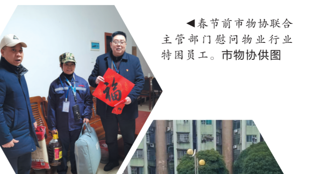
▲春节前市物协联合主管部门慰问物业行业特困员工。