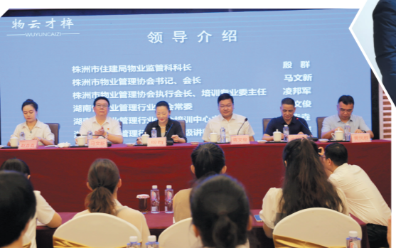
▲市物协联合省物协开展物业项目经理培训。