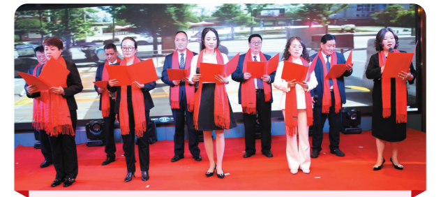
▲市物协理事长办公会成员在年会上朗诵《我们是株洲物业人》。

全督查,维护行业稳定。市物协每个季度和节假日前,与市住建局有关负责人深入到物业项目开展安全巡查,共查看60多个物业项目,督促企业及时排除了安全隐患20多个,维护了物业行业的和谐稳定。五是勇担社会责任,积极参与乡村振兴活动。为助力株洲炎陵黄桃消费帮扶活动,市物协向各会员单位发出了倡议书,同时,市物协会长马文新与张家界市物协书记覃伟直播带货,销售炎陵黄桃826箱,以实际行动为乡村振兴贡献力量。六是及时反应行业诉求,努力优化行业发展环境。市物协始终把优化企业发展环境、减轻企业负担作为工作重点。市物协多次组织召开关于二次加压电费及损耗等专题工作会议,通过工作函的方式将实际问题反映给株洲市相关部门及市水务集团。2023年12月13日,市物协会长马文新一行到常德市、长沙市调研二次供水设施设备管理经验,希望能通过努力为物业企业减轻负担,优化营商环境。这项工作已得到市住建局、市市场监督管理局、市发改委的高度重视。2023年9月22日,市物协与中华联合财险株洲中心支公司举行合作签约仪式。积极探索构筑“保险+物业+服务”模式,帮助企业规避管理风险。七是强化行业自律,物业服务进一步规范。换届后,行业自律督察委员会成立了新的班子成员,并多次召开工作会议,就进一步规范物业服务,提升物业服务品质,展示物业行业良好形象,传播行业正能量,促进物业行业健康有序向前发展等问题进行讨论部署。已召开4次专题会议,对违规企业约谈了4次,现场调查5次,进一步树立了行业的良好形象。八是开展健康有益活动,增强行业凝聚力。召开年会,对会员单位及个人进行表彰,促进会员单位之间相互交流。2023年3月7日,市物协举办“三八妇女节”座谈会。组织企业参加中国物业管理协会组织开展最美物业人宣传选树活动,广东铂美物业株洲分公司作品“便民洗车”入围。2023年3月至8月,市物协配合市住建局开展行业调研,写出了有份量的《株洲市物业行业高质量发展报告》。组织企业参加中国物业管理协会于2023年10月12日-14日在深圳会展中心举办2023年中国国际物业产业博览会。2023年11月23日,市物协信息专业委组织举办“株洲市物业行业2023年智慧物业沙龙活动”,通过将智能化等技术运用到物业实际管理中,达到“降本、提质、增效”的目标。市物协夏天送清凉物品到一线,冬天送棉被到项目,增加了行业凝聚力。2023年7月市物协被市民政局授予5A级社会组织殊荣。