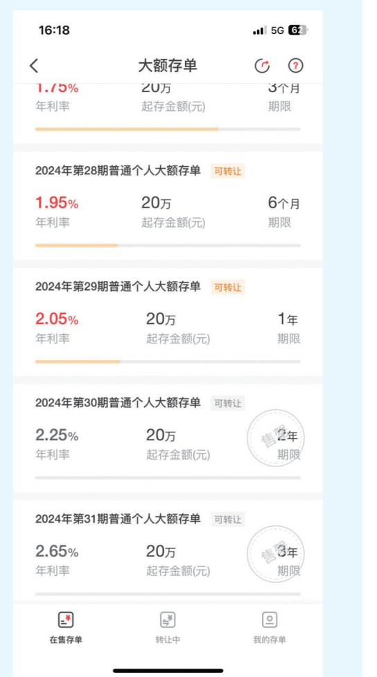
长沙银行App上，2年期、3年期的大额存单均显示售罄。