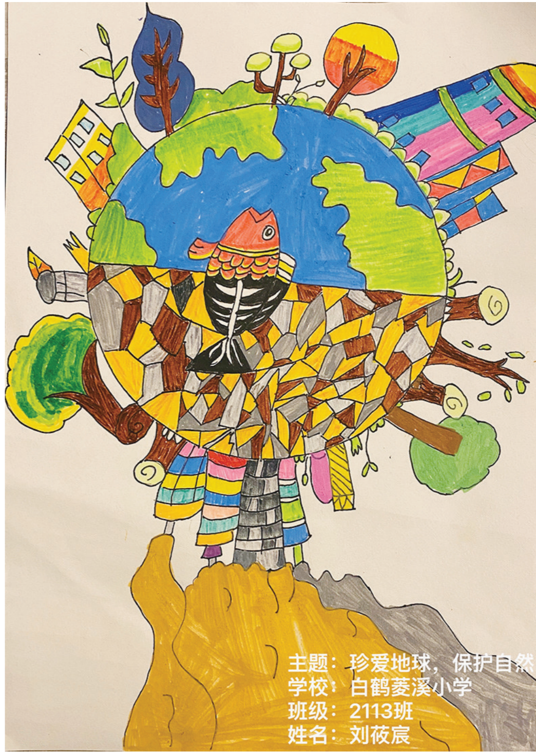
主题: 珍爱地球, 保护自然 学校: 白鹤菱溪小学 班级: 2113班 姓名: 刘筱宸