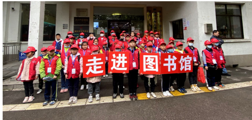
株洲日报社校园记者走进市图书馆，开展沉浸式阅读体验活动。

始感受另一种寓教于乐的学习生活？近年来，市图书馆将“小神龙”公益课堂、少儿故事大王大奖赛、神龙大讲坛等活动作为品牌活动推广，吸引更多青少年儿童走进图书馆、认识图书馆、打卡图书馆。同时，还结合节日活动