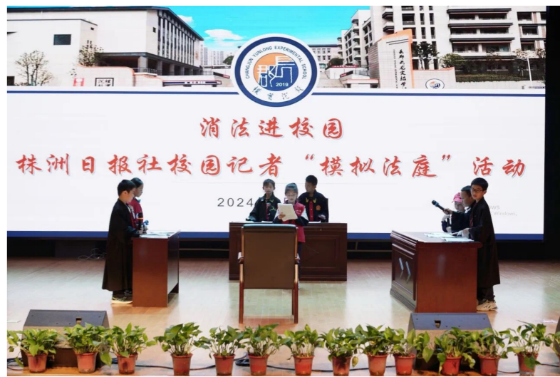
“模拟法庭”活动走进长郡云龙实验学校。

“开庭!”4月19日，随着一声清脆的法槌敲响，消费者权益保护法进校园活动正式启动。株洲六〇一中英文小学的校园记者们身着黑色法袍、律师袍，分别扮演起法官、律师以及原告(家长)、被告(店主)等角色，模拟法庭辩论当下关注度较高的学生追捧“盲盒”“不理性消费”问题。同样在长郡云龙实验学校，“模拟法庭”庭审由湖南金州(株洲)律师事务所主导，审理的是一起未成年人