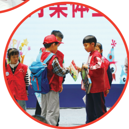
生日会上，校园记者分享图书。

本报讯(株洲晚报融媒体记者/谭筱) 孩子们集体过读书生日会是一种怎样的体验？4月20日，一场以“与春相约·与书为伴”为主题的株洲日报社校园记者四月集体生日会举行，将孩子们期待的游戏环节与书本结合，让他们体验了“书香生日”的快乐。