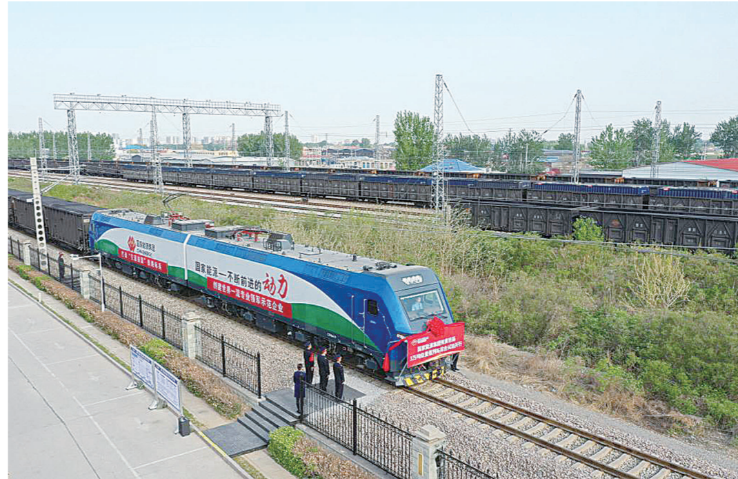
在朔黄铁路肃宁北站,准备开行的3万吨级重载列车。

本报讯(株洲晚报融媒体记者/高晓燕 通讯员/张灿强) 4月20日,总长超4公里、载重3万吨级的货运重载列车,从我国西煤东运第二大通道朔黄铁路肃宁北站出发后,顺利到达黄骅港站,标志着我国载重最大货运列车成功开行。负责这趟重载列车牵引的,正是中车株洲电力机车有限公司(以下简称中车株机公司)的“国能号”八轴电力机车。