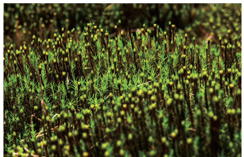
泥炭藓,金发藓,显现湿地生物多样性。