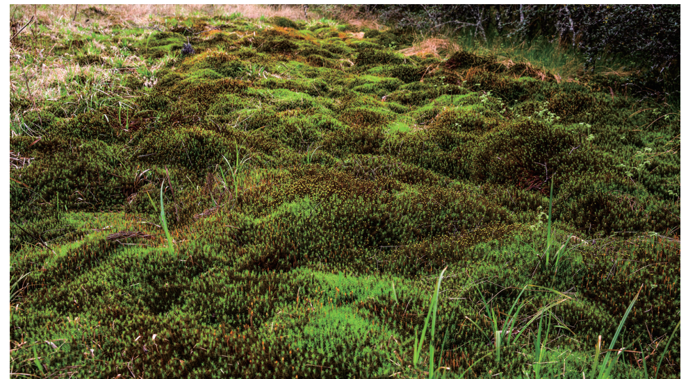
郁郁葱葱的沼泽化草甸湿地。