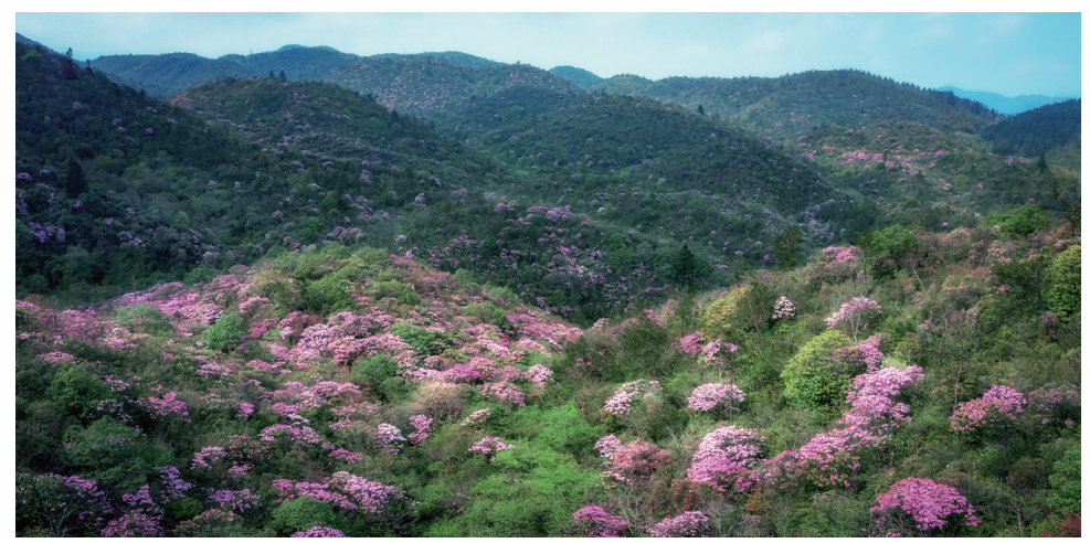
山野里的杜鹃花,宛如大自然的调色板。

古道经过之处的炎陵云上大院景区赵公亭附近,有一万多亩高山沼泽化草甸,春季多雨时节,草甸生长旺盛,绿意盎然。专家研究推算,其存活年代超过1万年。湿地被称为“地球之肾”,能净化水质,涵养水源。炎陵这片1.2万亩的沼泽化草甸湿地,常年空气湿度保持在80%左右,阳光充沛,人迹罕至,是苔藓和地衣等植物的理想生长地。