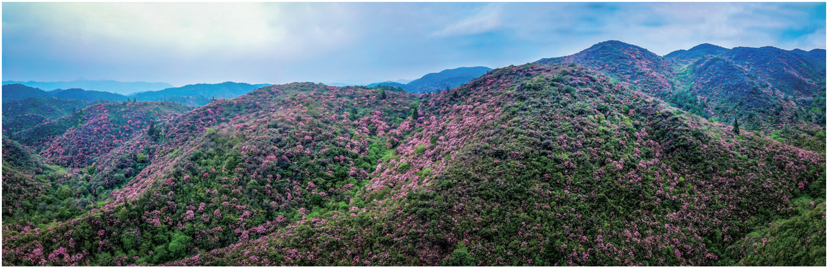
从空中俯视图群山,漫山遍野的杜鹃花争奇斗艳。