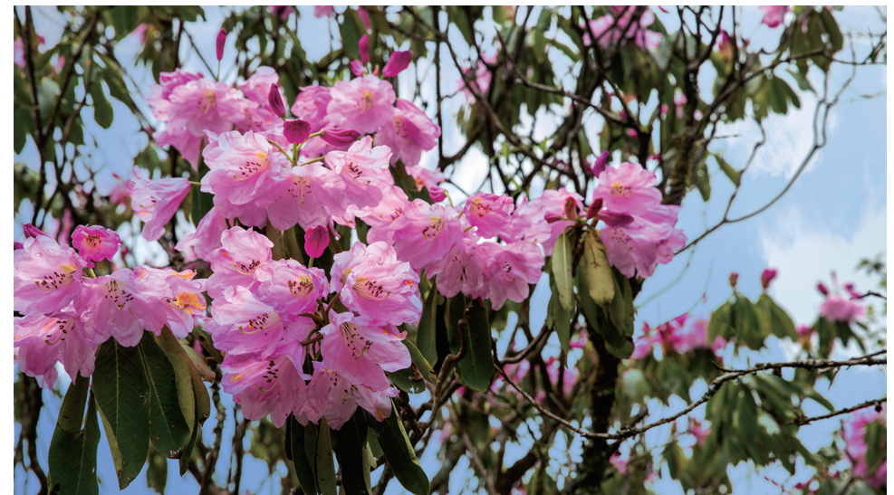
粉色的杜鹃花,婉约缠绵,浪漫优美。