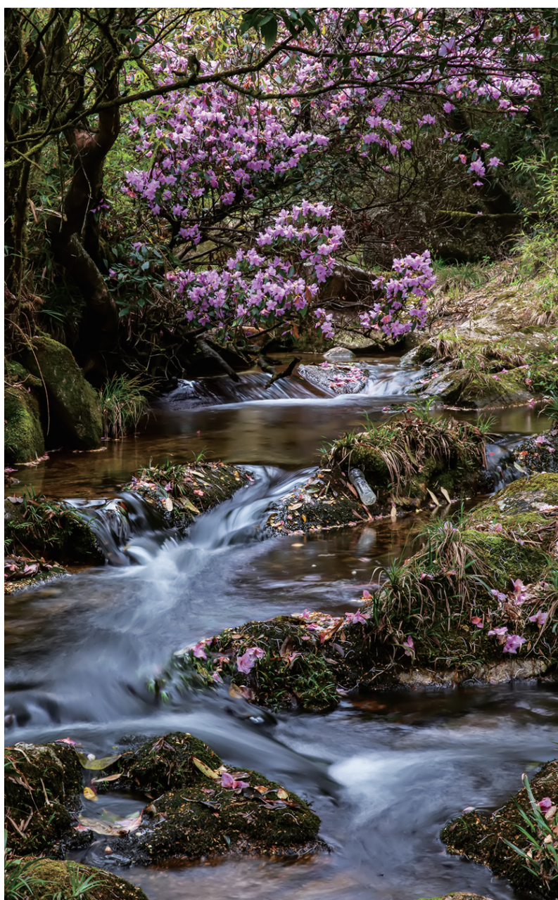
在流水潺潺的小溪边,杜鹃花娇艳地绽放。