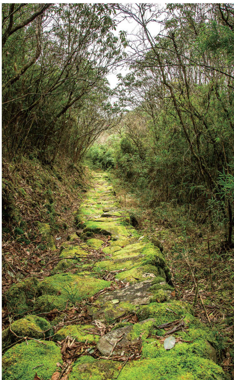
古道深处,人迹罕至,道路的石块上布满了青苔。