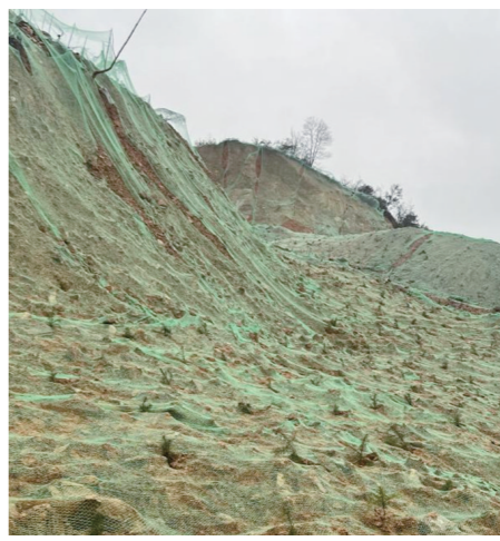
醴陵市明月镇马恋社区整改中。

截至目前,该区“办不成事”反映窗口累计收集群众、企业提出的有效问题建议43起,其中当场回复解决27条、特事特办9件、共性问题转部门解决4个,企业和群众满意度、获得感、归属感、认同感不断提升。