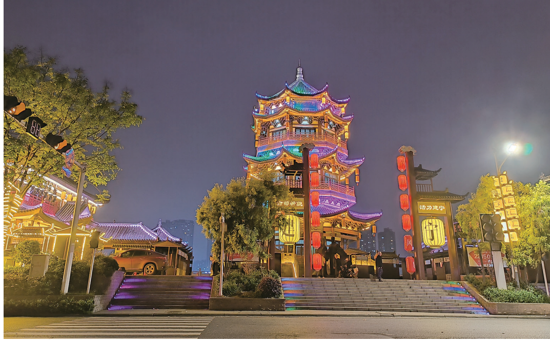
建宁文化市集已完成主体建筑灯光调试

本报讯(株洲晚报融媒体记者/伍靖雯 通讯员/沈玮) 尝地道美食、赏民俗民艺、玩体验式互动灯光秀……5月1日,株洲首个国风主题文旅街区——梦回宋“潮”建宁文化市集将正式迎客,邀请市民朋友身临其境做一回“宋人”,感受株洲千年繁华。