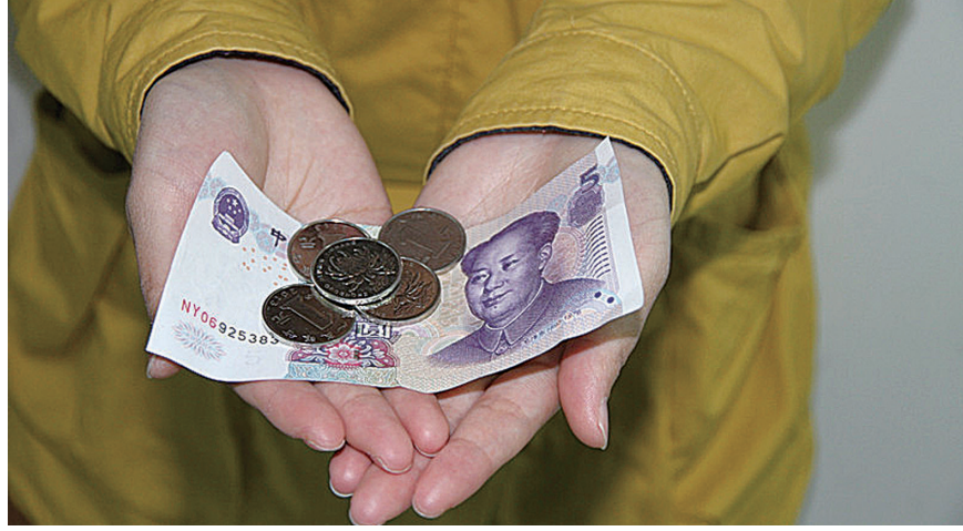
有的家长只管给钱却不管用钱

“我们以为不给钱可以避免她乱花钱,却没想到错过了学习理财的机会。”小萧母亲说,上次班级义卖活动中,才发现女儿看着同学们纷纷拿出零花钱购买物品、参与互动,孩子却只能在一旁默默观看,才意识到他们忽略了对孩子金钱管理能力的培养。