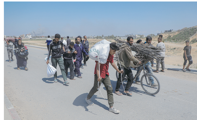
4月14日在加沙地带中部拍摄的向北返家的人群。

据巴勒斯坦加沙地带卫生部门14日公布的数据，过去24小时，以军在加沙地带的军事行动导致68人死亡、94人受伤。自新一轮巴以冲突爆发以来，以军在加沙地带的军事行动已造成超过3.37万人死亡、7.6万余人受伤。