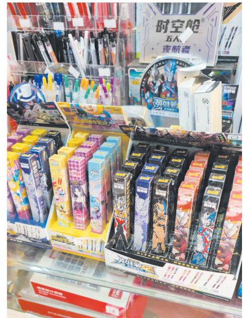
学校周边文具店售卖的盲盒文具。