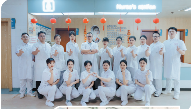
▲日益壮大的团队。

进入2016年,科室不断派出医护前往全国心理培训班进行专业培训,并引入全国教育系