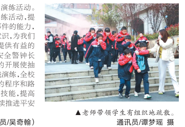
▲老师带领学生有组织地疏散。

为进一步提高演练效果，芦淞区消防救援大队教官给全体参加演练的师生讲解并演示干粉灭火器的正确操作使用方法。全体师生认真观摩后进行了灭火器的使用操作训练。在甘教官的指导下，部分同学进行了灭火扑救的实操演练。龚景辉对此次消防演练的效果表示肯定。全校师生以良好的面貌、冷静的心