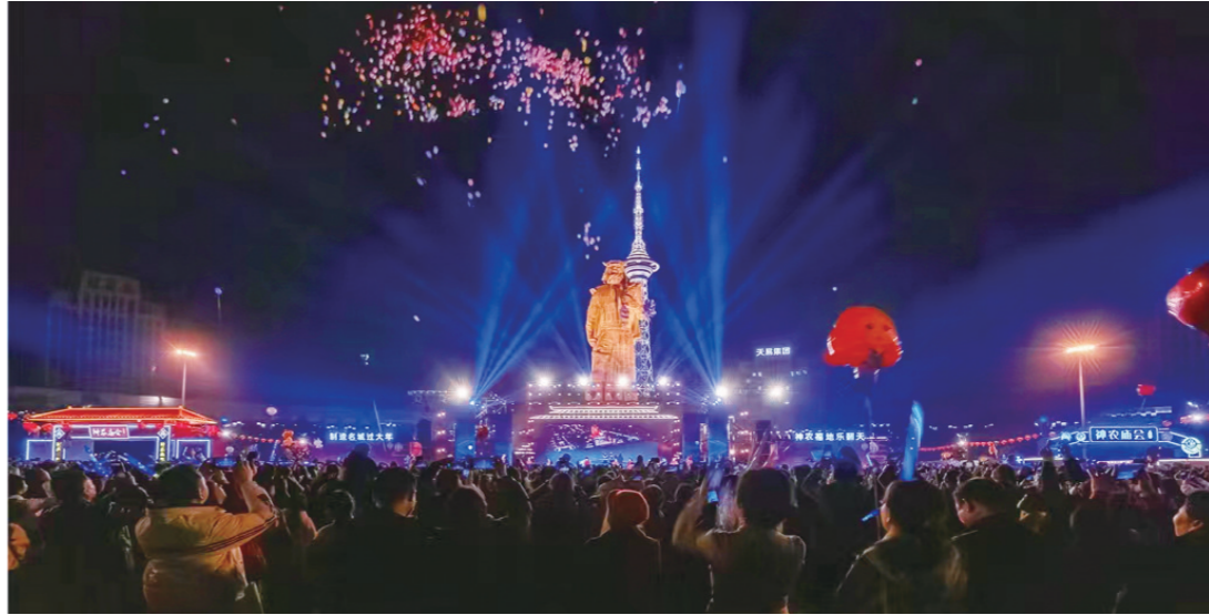
春节期间，神农城景区因为神农庙会，每天人流如织。

2024年，株洲将有哪些文化、旅游、体育大事？3月25日，我市举行2024年文化旅游广电工作会议，发布了市文旅广体2024年工作要点。2024年，我市文旅广体工作将在服务大局有更大作为，加快建设“神农福地 制造名城”知名旅游目的地。