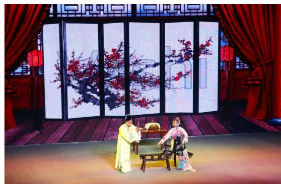
惠民公益演出在神农大剧院展演。