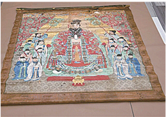
归还日本的冲绳文物。

美国联邦调查局(FBI)近日宣布，已将22件被掠夺的珍贵历史文物还给日本政府。这些文物是在马萨诸塞州一个家庭中发现的。这户不愿透露身份的家庭在整理已故父亲的遗物时，偶然发现了这些文物。这户家庭的亡父曾是一名二战老兵。 据悉，这些文物包括六幅肖像画、一幅19世纪的冲绳手绘地图以及多种陶器和瓷器。冲绳当地政府曾在FBI的国家被盗艺术档案中登记了部分文物。 美国史密森尼学会发现，这些肖像画描绘的是冲绳王室。随艺术品附带的一封信让历史学家认定，这些文物是在二战快要结束前被掠夺的。 (据都市快报)