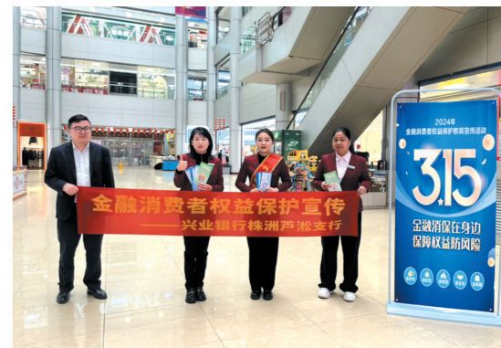
▲“3·15金融消费者权益保护”活动现场。

3月15日晚上，兴业银行株洲分行开展了金融消费者权益保护为主题的沙龙活动，活动现场通过向客户发放宣传折页，讲解消费者权益保护法的相关知识，深入剖析典型案例，设置趣味有奖问答，提醒消费者切勿盲目追求高收益产品，谨防网络投资骗局，避免进入投资误区，提醒消费者掌握维权的合法渠道，在购买产品前全面了解自身风险承受能力，提高对金融诈骗的警惕性。 兴业银行株洲分行通过在网点布设金融知识问答台、3.15行长接待日活动倾听消费者意见、进商圈发放宣传折页、开展专题沙龙活动问答互动，将金融