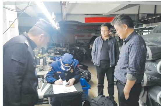
执法现场。

本报讯(株洲晚报融媒体记者/杨凌凌) 近日,新芦淞工业园23栋某加工厂因存在违法设置“格子房”,生产车间内吸烟等安全生产和消防违法行为,相关部门对违法行为人做出行政拘留3日的处罚。