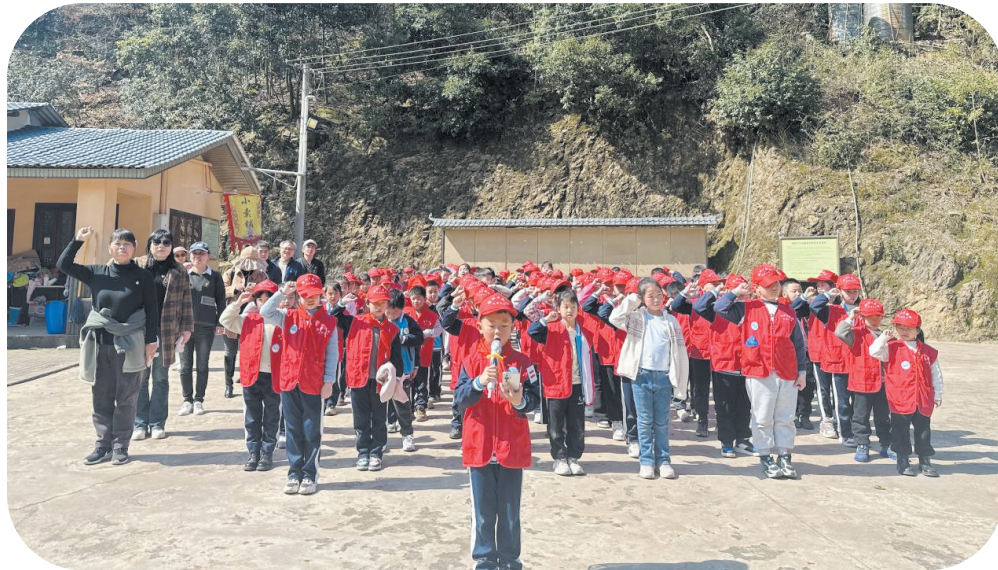
红旗路小学党员教师代表及校园记者代表共同宣誓植树节倡议。