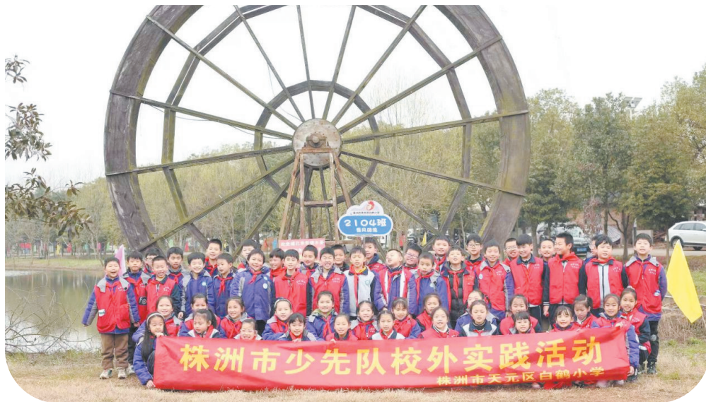
白鹤小学校园记者开展植树活动。