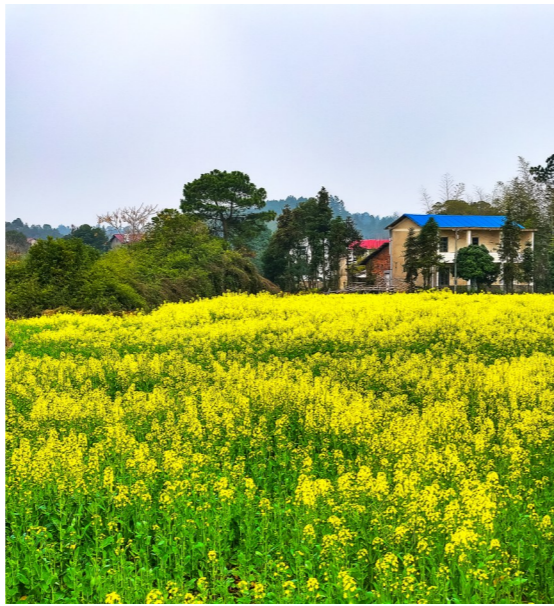
三门镇苍霞村的油菜花。网友/凯哥一曲 摄