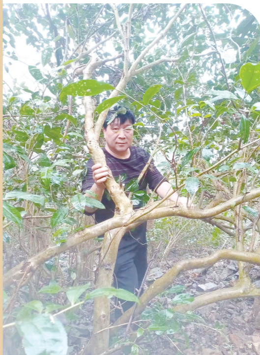
村民手扶古茶树。

老茶树焕发新生机。如今,火田镇借助“野生茶”和古茶树开发与保护的契机,把“野生茶”产业打造成为“一镇一特”农业主导产业,依托生态旅游资源,结合茶文化历史,建成以卧龙为中心的生态旅游观光群,全面推进茶旅融合,打造成茶旅小镇。