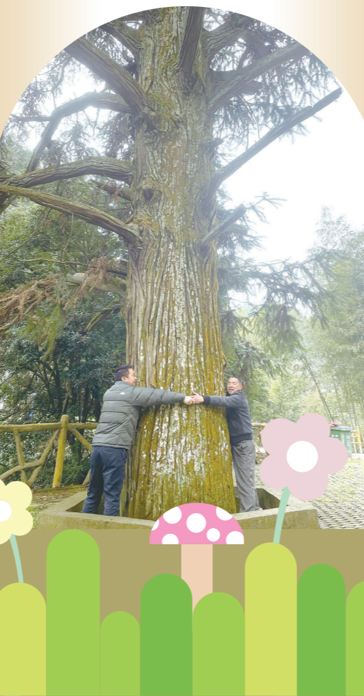
古杉需 4 人才能合抱。

这时,村口走来一位老奶奶,背不佝,步轻松,一向才知近九旬高龄。村民们说,原树山口组 80 多人,其中 70 岁以上的老人有 26 名,是远近闻名的长寿之地。当地村民们说,可能是仰仗了古杉的护佑。