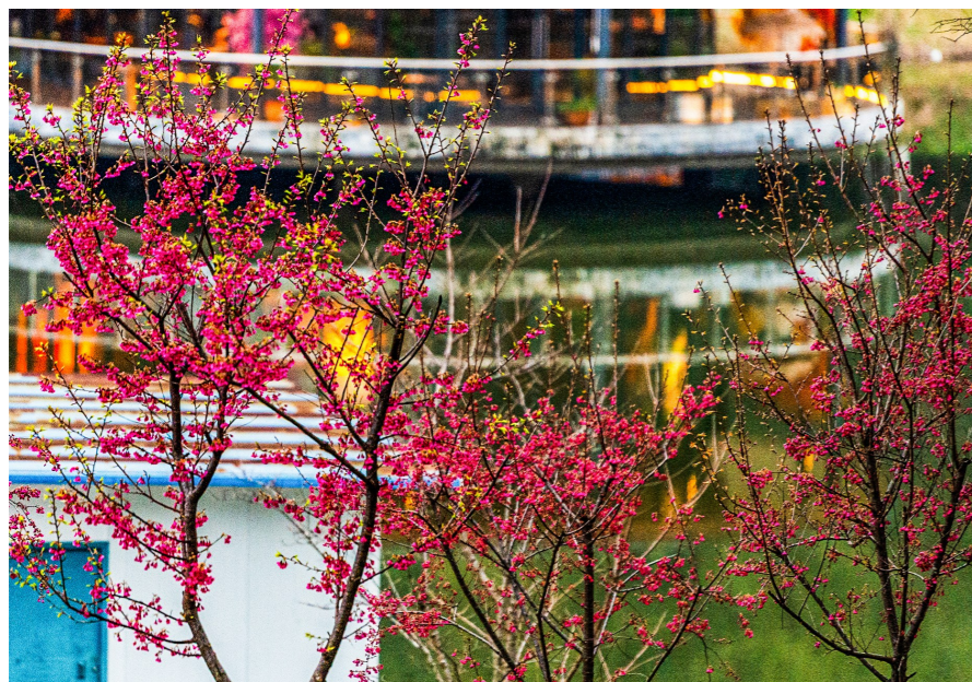
大京水库的游船边,红花夺目。