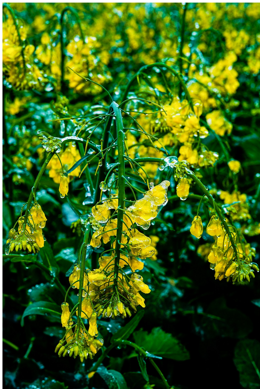
攸县石羊塘油菜花,在冻雨中挂冰。