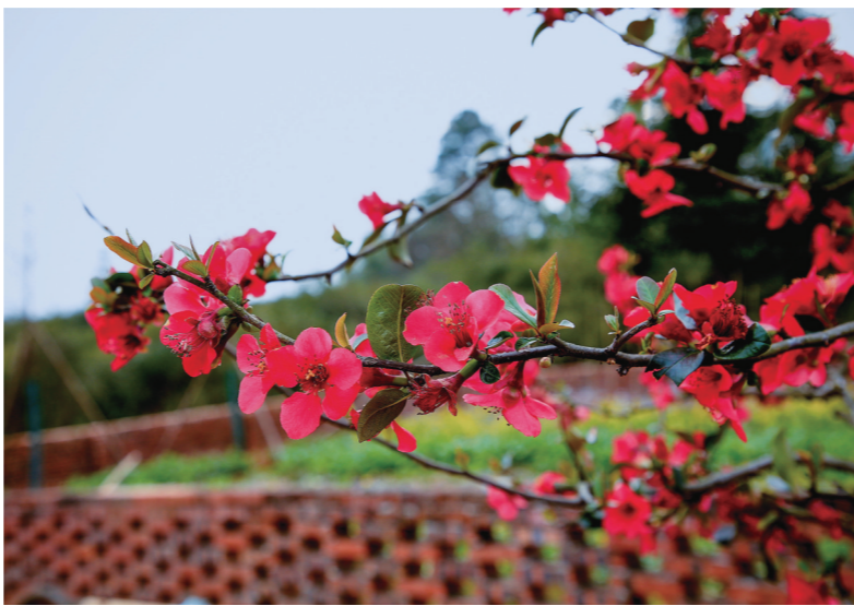
茶陵县农户家的海棠花红艳靓丽。