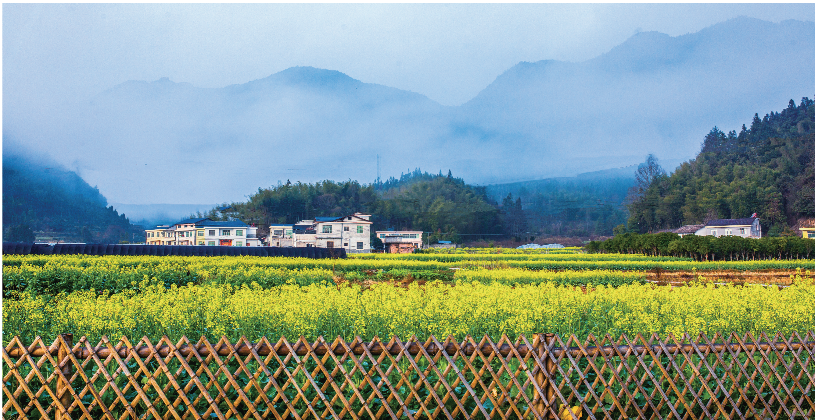
炎陵县水口镇水西村的油菜花。