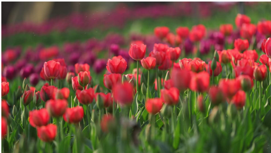
风光带的郁金香。欧阳华 摄