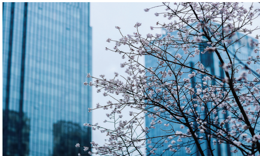
高科集团总部旁边,早樱盛开。