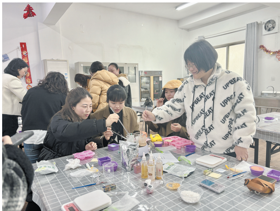
在校园里,有这样一群女性,她们在讲台上传播知识,在书桌前钻研学术。连日来,我市各中小学校以不同的形式庆祝第114个“三八”国际妇女节,向这些“知识的传灯者”送上祝福。图为八达小学教师来到株洲日报社社园记者手工学院开展妇女节活动。