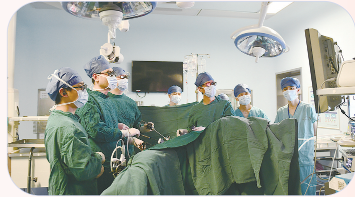
株洲市中心医院第一党支部的专家正在进行公开手术直播演示。