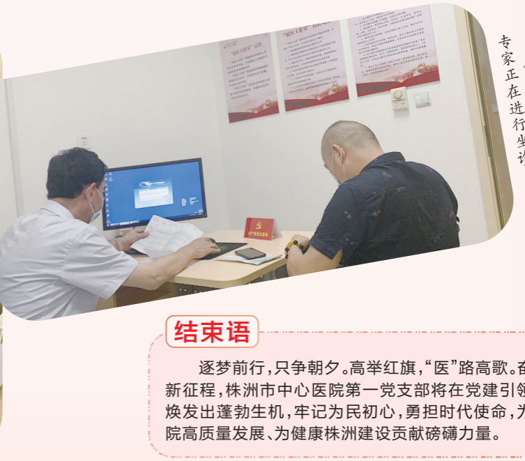
“民医工作室”的党员专家正在进行坐诊。