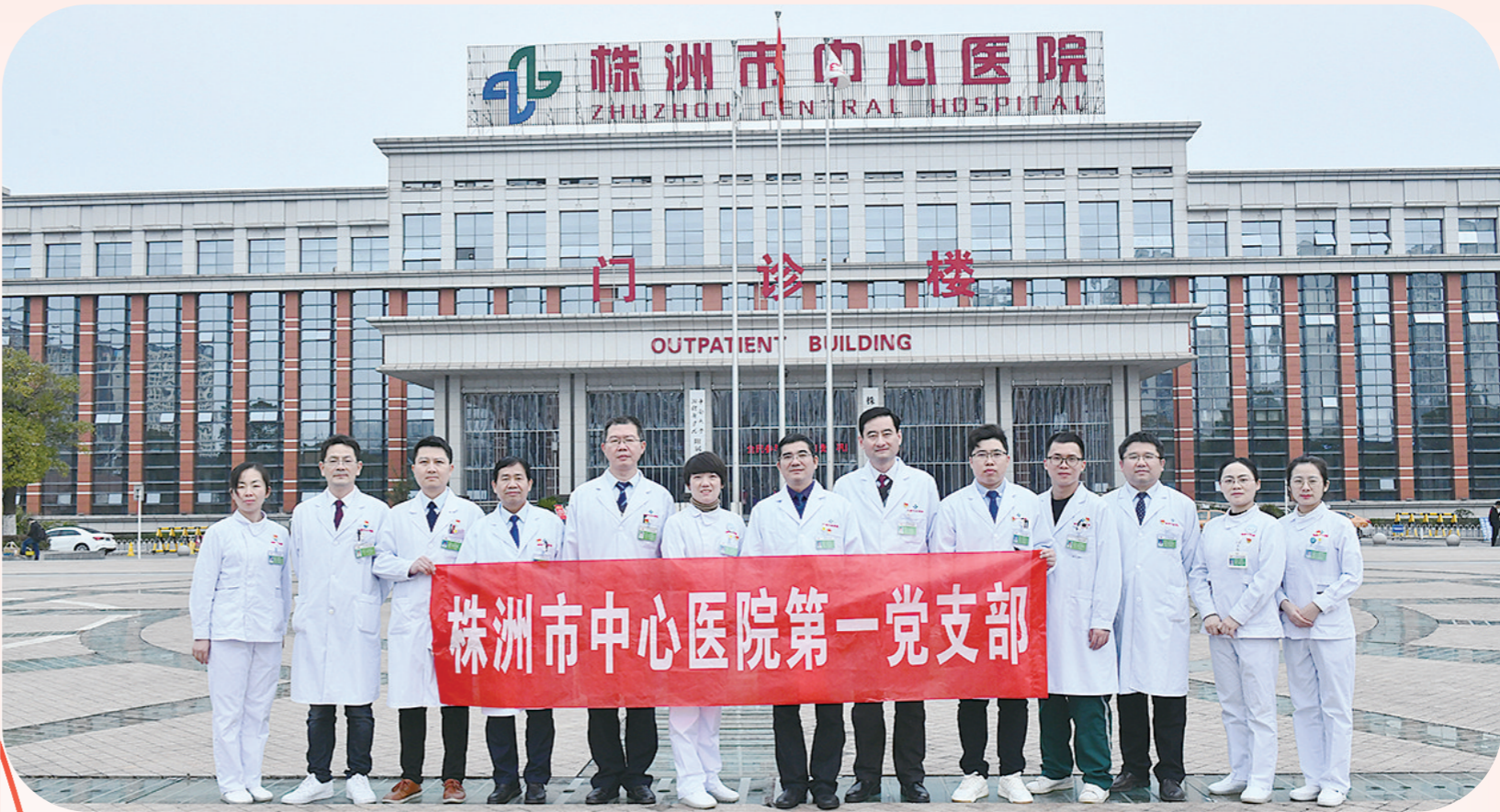
株洲市中心医院第一党支部部分党员合影。