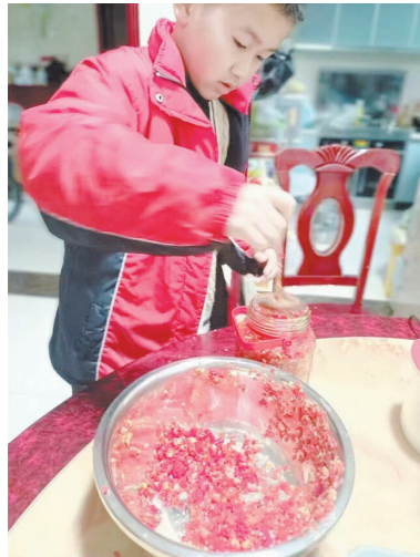
栗树山小学学子制作了剁辣椒。