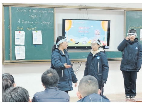
学生以角色扮演形式展示英文阅读成果。记者/戴凛

本报讯(株洲晚报融媒体中心记者/戴凛 通讯员/王佳奕) 通过漫画讲述校园霸凌的案例,并引起全班同学思考;仙女棒烟花穿过橘子依然可以燃烧,它是什么原理……3月6日,芦淞区寒假教育成果展示暨芦淞区2024年春季开学会议在株洲市外国语学校举办,全区中小学教师代表现场观摩示范课,并参与该校全科阅读分享活动。