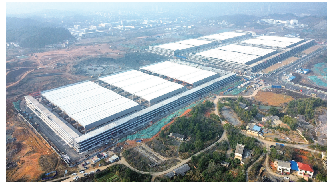
三一智慧钢铁城二期一标段基本完工,预计今年6月交付。

“这个铁路专线就是我们项目的生命线。”黄婷表示,对于钢材物流来讲,铁路是最便捷、成本最低、性价比最高的一种运输方式。相比汽车运输,每吨