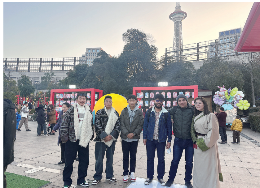
在株就业的西藏籍高校毕业生游览神农城。