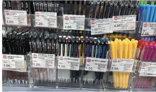
我市一家商场中,低价实用的文具占主导。

的文具,让人眼花缭乱。但好在开学前,老师给同学们的温馨提示中建议“购买文具应以简洁实用为主”,所以孩子也就没什么特别要求了。