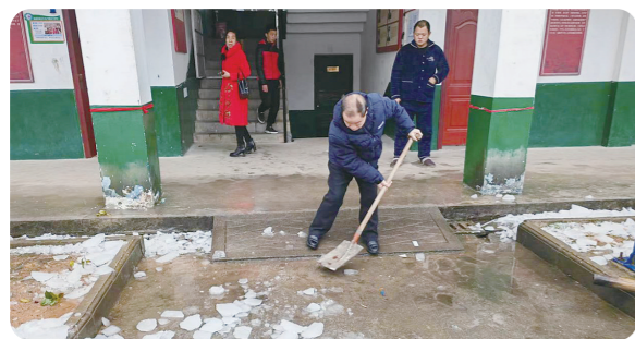
龍門學校教師清理道路積雪。

株洲日報訊(全媒體記者/孫曉靜 通訊員/張占鑫)兔奔前程去,龍迎暖春來。隨着新學期的腳步悄然而來,近日一場小雪飄落在瀘口區龍門鎮龍門學校的每個角落。為了給學生提供一個安全、暢通的校園環境,2月25日,該校教師開展一場除雪大仗。