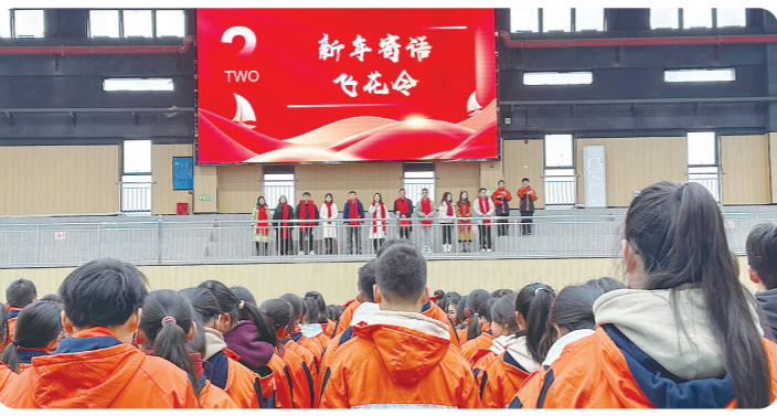
新學期龍騰虎躍。

“別樣有趣的‘飛花令’,讓大家感受到了中國古詩詞的博大精深,讓傳統文化在心中生根發芽。”李同學說,在開學典禮上感受到老師用心的安排,讓大又學到了很多新的知識。比如詩句“龍行踏踏氣,天半語相聞。”出自唐代閻朝隱的《奉和登驢山應制》,詩句很有氣勢,展現了別樣的風采。