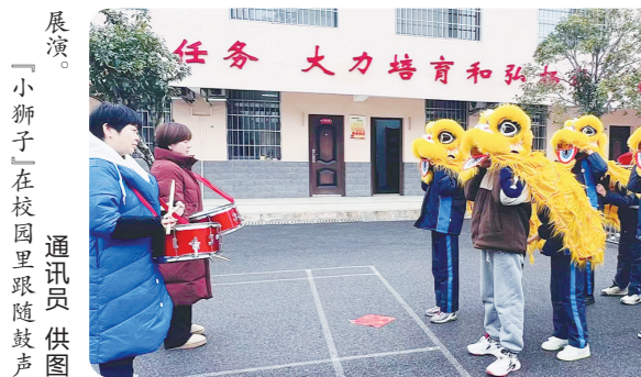
「小獅子」在校園里跟隨鼓聲。

株洲日報訊(全媒體記者/戴濤 通訊員/李昕酌 賀思明)2月26日,荷塘區明照小學舉行新學期開學典禮。學生們以舞獅這一傳統文化活動歡慶新學期的到來,既展現了他們的才藝,又寓意著新學期充滿活力與希望。