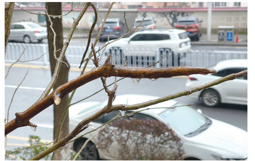
城区不少行道树枝上已经挂有细碎的冰粒。

株洲日报讯(全媒体记者/伍靖雯)新一轮寒潮来袭，为保障城市道路畅通和市民游园安全，全市城管园林部门已迅速启动绿化“防冻”预防和应急措施。