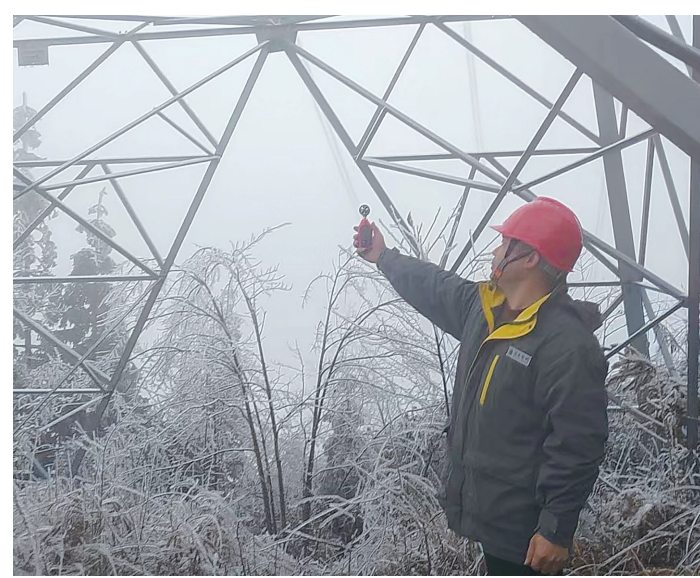
供电人员对设备运行进行监测。

株洲日报讯(通讯员/吴珊 陈文琴)“请大家抓住寒潮来临前的‘窗口期’，对容易造成冰雪压塌竹筒倒伏碰线的点位再次开展巡视和清理。”2月20日，株洲炎陵水口供电所组织东方红(火车头)共产党员服务队对10千伏策梨线、策源线开展树竹砍伐扫障工作，确保电网线路稳定运行。