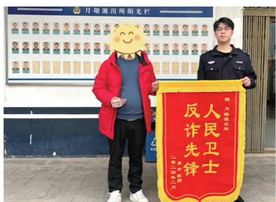
熊先生从重庆来到株洲送锦旗。

体彩 排列3 第2024042期 3 4 2 排列5 第2024042期 3 4 2 7 6 大乐透 第2024019期 19 20 26 29 30 03 04