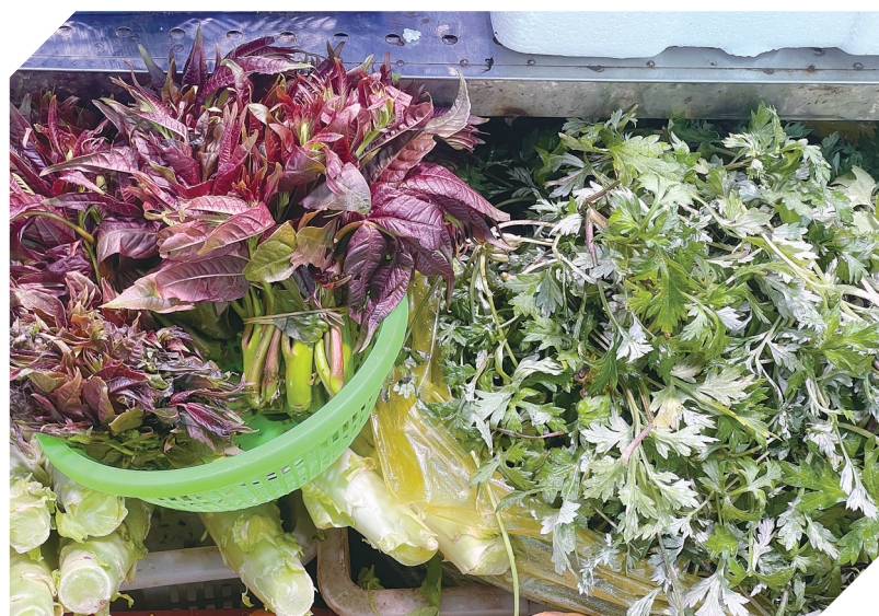
香椿、藜蒿等时令野菜上新。