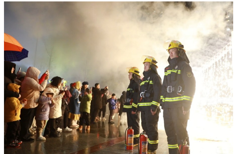
除夕夜，消防救援部门在各烟花燃放集中区执勤。

市消防救援支队相关负责人表示，数据显示，今年接警出动次数与2023年(期间)同比下降26%，火灾同比下降33%。尤其是2月9日(大年三十)晚上，消防救援部门科学谋划、力量前置，火灾扑救起数同比减少三分之二。