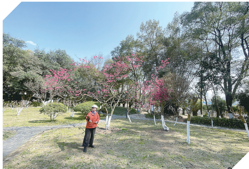
石峰公园蔷薇园内早樱绽放。