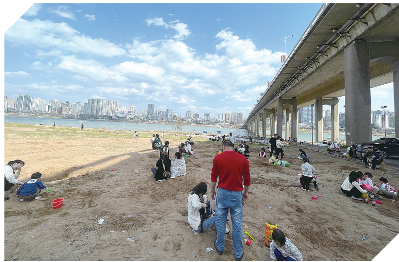
湘江风光带沿线，不少市民带着孩子在此游玩。