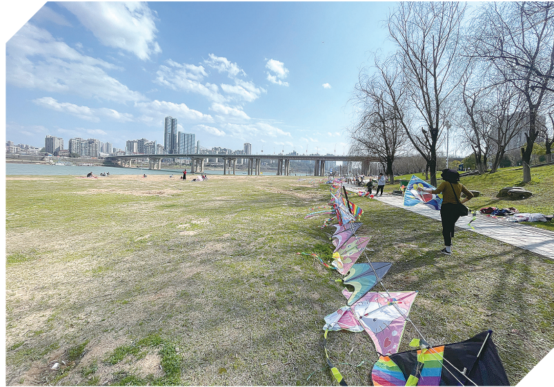
市民踏春出游带动风筝热。

“去年这时候卖30元一斤的藜蒿，现在每斤只要8元钱，本地的水芹菜6元一斤。”这名老板告诉记者，这两天最俏的还是本地的野生水芹菜，不过产量不多，所以每次都最早卖完，剩下的都是人工种植的水芹菜，也值得一尝。