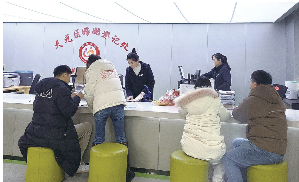
除夕当天，婚姻登记处迎来办理结婚登记的新人。

本报讯(株洲晚报融媒体记者/刘平 通讯员/李娜)2月9日是除夕，当天全市各县市区民政局婚姻登记处照常办理各项婚姻登记业务，全天共为56对新人办理了结婚登记业务，让新人们过年、结婚双喜临门。