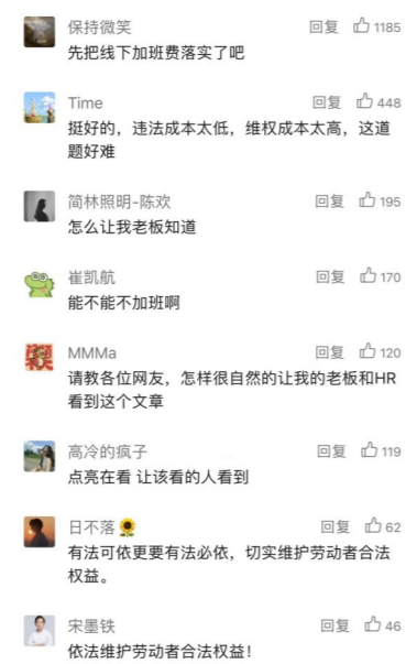
网友讨论“线上加班”有加班费一事。