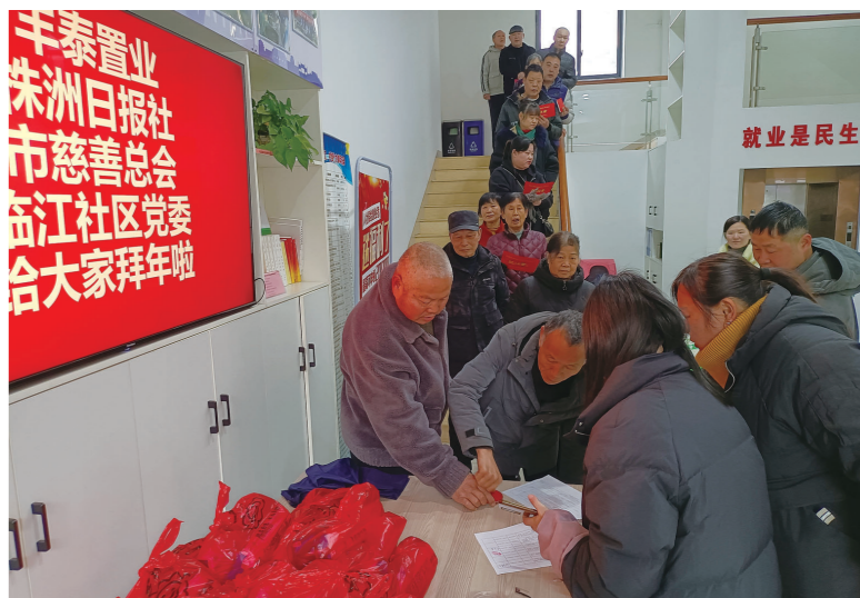
临江社区爱心年货领取现场。

2月3日上午,天元区临江社区20户困难群众,领到了300元现金红包和米、油、面等过年物资,这些爱心年货由株洲丰泰置业有限公司送出。丰泰置业已经连续12年参与“送年货”公益公益活动,今年认捐2万元,已顺利为天元区40户特困群众送上爱心。