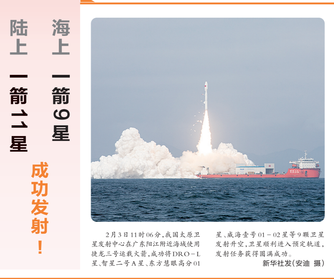
2月3日11时06分,我国太原卫星发射中心在山东阳江附近海域使用捷龙三号运载火箭,成功将DRO-L星、智星二号A星、东方慧眼高分01星、威海壹号01-02星等9颗卫星发射升空,卫星顺利进入预定轨道,发射任务获得圆满成功。

数百名美欧官员 公开反对以在加沙军事行动 据新华社华盛顿2月2日电 据美国《纽约时报》2日报道,数百名来自美国、英国和欧盟成员国的官员当天发表一封公开信,反对本国政府支持以色列在加沙地带的军事行动。 《纽约时报》援引公开信组织者和知情人士的话报道,这封信得到约800名现任官员的支持,其中约80人来自美国国务院等美国政府机构。来自另外8个北约成员国以及瑞典和瑞士的官员也支持这封信的立场,他们中大多数人在外交部门工作。 报道指出,这些官员在信中说:“我们政府的政策可能会导致严重违反国际人道主义法、犯下战争罪,甚至是种族清洗或种族灭绝。”他们表示,本国政府需要改变在本轮巴以冲突中的政策方向。他们此前已从内部渠道提出了担忧,但却被忽视。 报道指出,这一公开信反映出美国、英国和欧盟国家领导人支持以色列的政策在这些国家的公务人员中激起了不满。