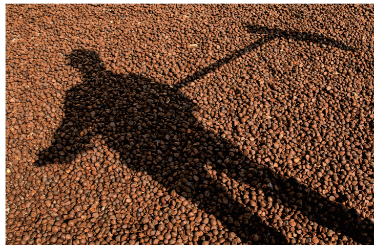
阳光在茶籽上映射出农户忙碌的身影。