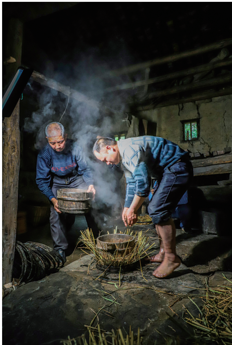
攸县莲塘坳镇巨田村的传统水力榨油房已有百年。