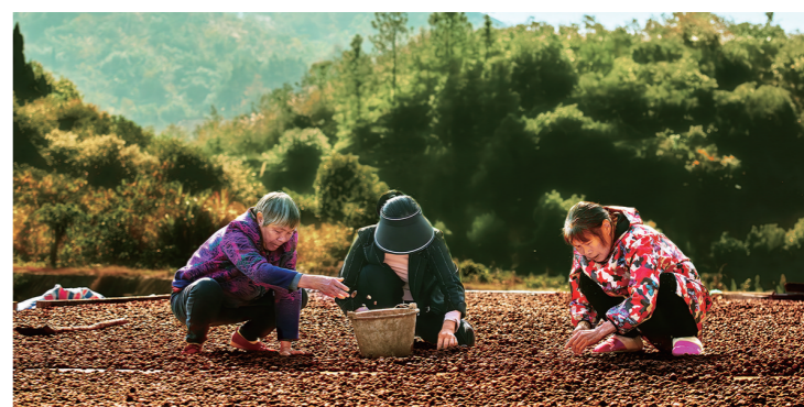
天放晴,溁口区油茶种植户们在忙着剥壳、晾晒茶籽。

1月27日,由市林业局主办,株洲日报社、株洲博物馆承办的株洲市“湘天华”杯首届油茶摄影大赛颁奖典礼暨优秀作品展在株洲博物馆拉开帷幕。展览将持续一个月,欢迎市民前往观展。现将部分优秀作品予以刊登。