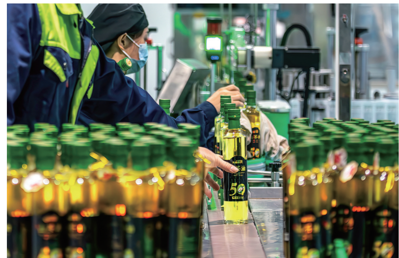
现代企业已将茶油生产自动化,这是湖南亚美公司生产线。