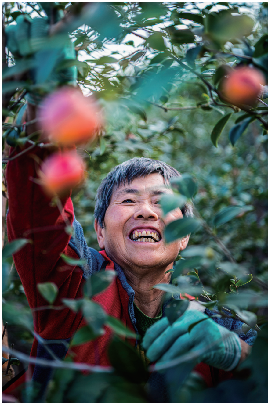
醴陵市金桥生态农林公司油茶基地,村民们喜采油茶果。