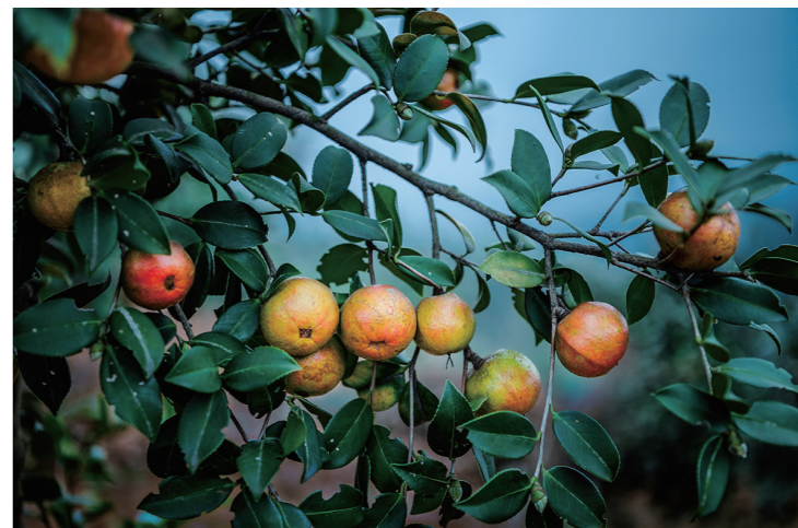
溁口区朱亭镇金福村油茶基地内,泛红的油茶果挂满枝头。