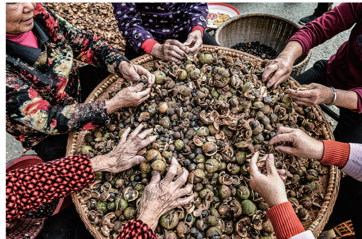
攸县网岭镇的村民聚在一起劳作。