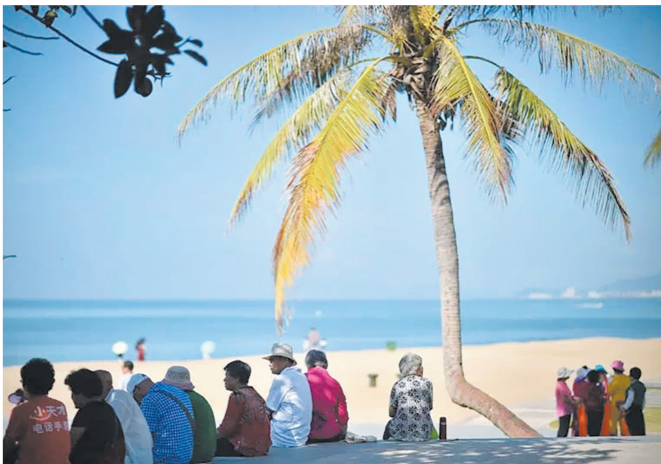
飞向南方，寻找一个温暖的地方度过冬天。

据业内人士介绍，株洲市民主要的旅居目的地城市是海南各省市和昆明、西双版纳等。参加旅居公司旅居项目的人员主要是收入固定且儿女大力支持的退休人群。