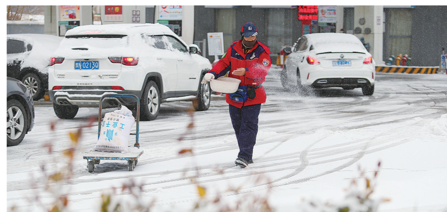
2月1日,河南省商丘市的一名加油站工作人员在撤盐除雪。