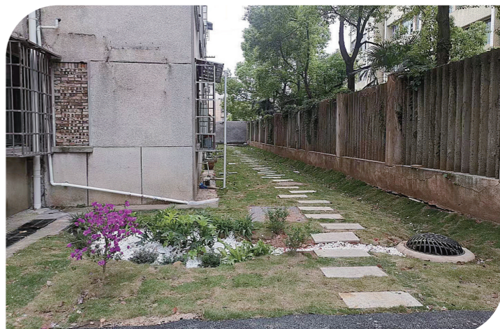
改造后的原建工技校小区。

据悉,目前,各级政府正在组织开展城中村摸排,形成城中村、自建房、棚户区分类统计台账,分类施策。此外,我市城中村改造工作专班,已经纳入市城市更新办领导和统筹。