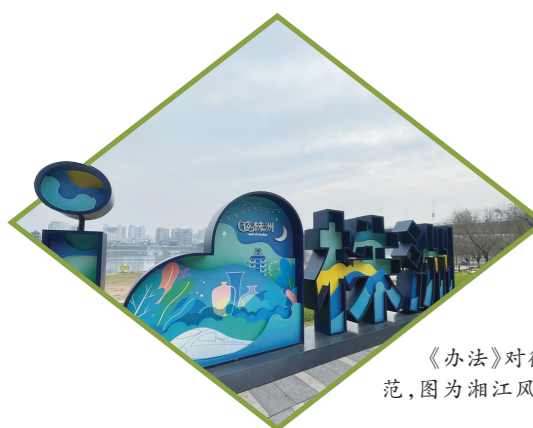
《办法》对微亮化的应用场景进行梳理规范,图为湘江风光带上的微亮化景观设施