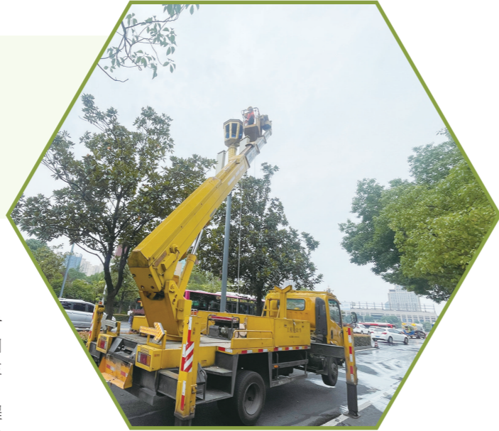
今年,我市计划探索路灯照明合同能源管理模式,提高路灯精细化管理水平。

据悉,《办法》结合当前我市城市照明管理工作实际,强化规划建设、维护等全流程的建章立制,切实保障市民夜间出行安全,助力城市夜间经济产业发展。