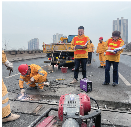
桥梁伸缩缝维修环节节能比拼装现场