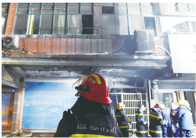
一月二十日拍摄的火灾现场外景。新华社记者 周密 摄

根据习近平指示和李强要求，中共中央政治局委员、国务院副总理张国清率有关部门负责同志赶赴现场指导事故处置工作。