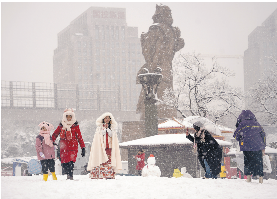
在历经去年的无雪年后,株洲迎来了2024年的第一场雪,也是这10年来最大的一场雪。