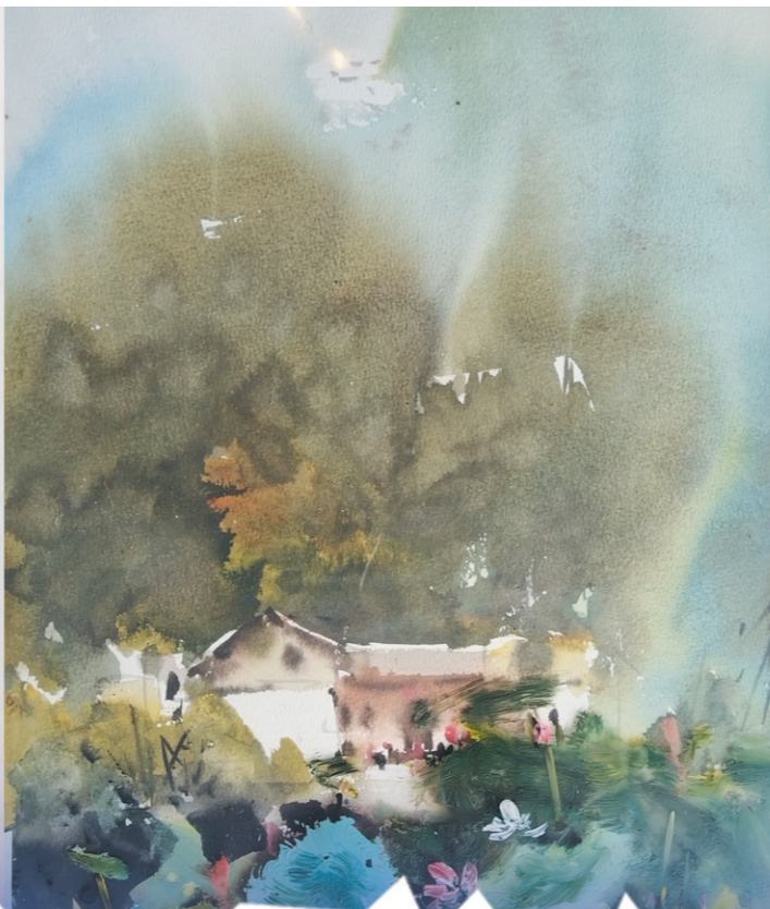
贺安成画作《伟人故里》(综合材料) 2022年