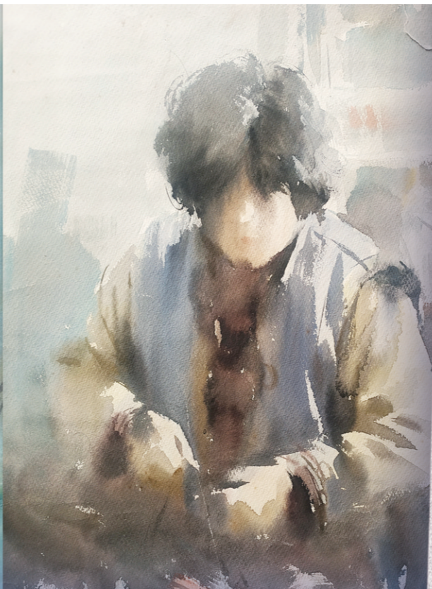
贺安成画作《慈母手中线》(水彩) 1987年