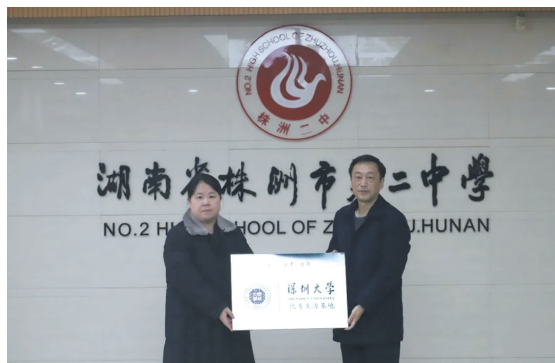
▲深圳大学领导为市二中授牌。

本次授牌仪式是深圳大学对市二中办学实力的认可,也是对全体在深大就读的二中校友的肯定,更是二中继续踔厉奋发,追求卓越的助力。优质生源基地的建立,有效搭起深大与二中友谊的桥梁,不断拓展市二中实施素质教育的新思路,共同培养高层次、高水平的人才。二中人表示将继续务实创新、锐意进取,充分依托高校资源形成教育合力,不断探索培养