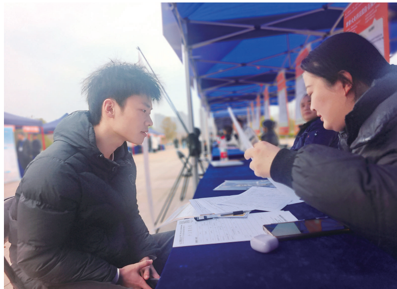
高校毕业生专场招聘会现场。

湖南工大毕业生不急于找工作吗?显然不是。数据显示,近几年来,该校毕业生就业率超过了89%,高于全省高校毕业生平均水平。不过,从去向看,仅约37%的毕业生