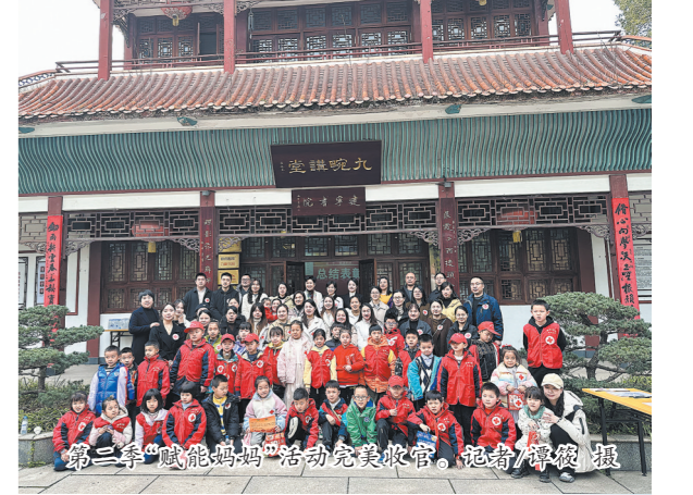
第二季“赋能妈妈”活动完美收官,现场气氛热烈