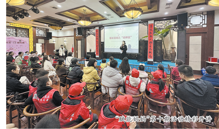
“赋能妈妈”第十期活动精彩瞬间

本报讯(株洲晚报融媒体记者/谭筱 实习生/罗婉婷) 帮焦虑妈妈宽心,陪孩子终身成长。1月14日,株洲市红十字会、株洲市三医院携手株洲市九晚书院、株洲日报社校园记者俱乐部举办第十期“赋能妈妈”行动——“做成孩子的治愈系妈妈”,此次活动也是第二季“赋能妈妈”收官之战。