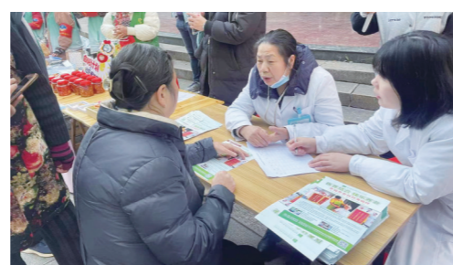
居民排队进行血压、血糖、视力等常规检查。

截至目前,宋家桥街道已举办6场“近邻管家·公益赶集日”文明实践活动,参与此项服务的志愿者超200余人次,受益居民超千人。工作人员介绍,宋家桥街道将继续统筹各方资源,为辖区居民链接更多更优质的便民服务项目,