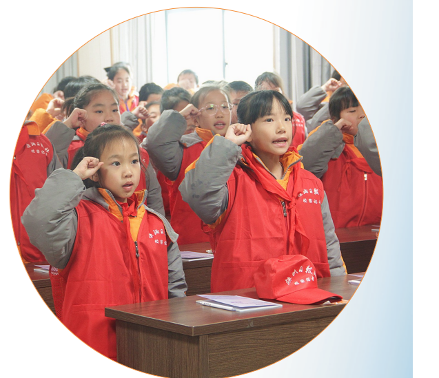
天元小学2024年度校园记者集体宣誓。

校园记者们纷纷表示:一定会用心发现美好,记录生活,用笔书写生活中的真善美。小记者,大舞台。亲爱的校园记者们,新的一年,新的起点,让我们怀揣梦想,向未来出发。