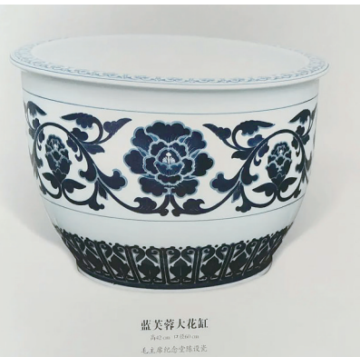
毛主席纪念堂用瓷《釉下彩蓝芙蓉大花瓶》