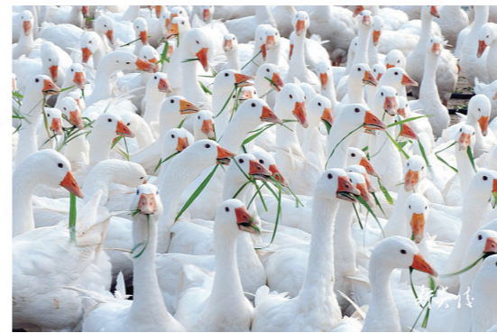
在炎陵县鹿原镇,农户养殖的白鹅。