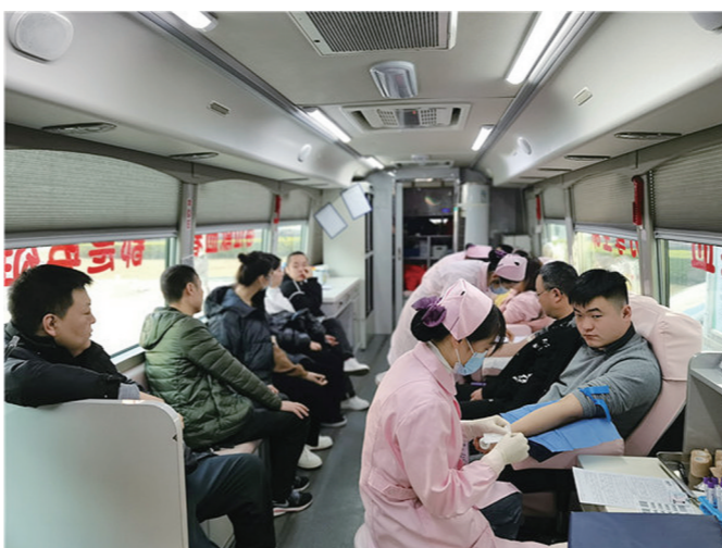
株洲市卫生健康局的工作人员正在积极参与无偿献血。

“近期,由于天气寒冷,加之人流量的季节性变动,我市的无偿献血工作遭遇严峻考验。”市中心血站相关负责人呼吁,更多的爱心团体和个人能加入无偿献血队伍,用自己的热血为生命接力。