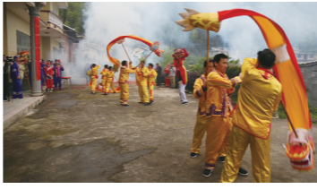
炎陵县十都镇杨岐畲族村三月三活动现场。