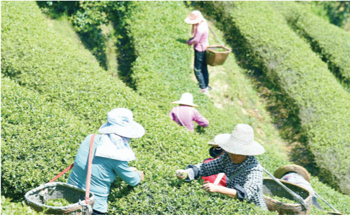
大院农场 飞龙窝正在采摘茶叶。