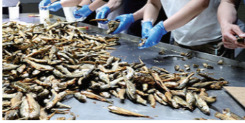
醴陵培菜火焙鱼加工现场。