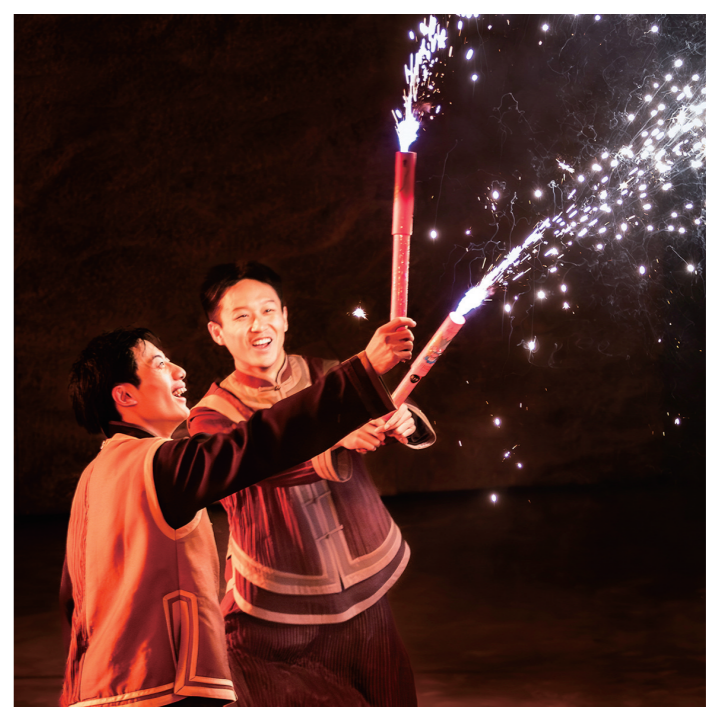
传统的服饰, 烟花的燃放, 跨年的欣喜。