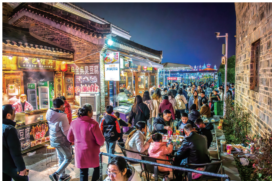
古城美食街, 让人接踵而至。