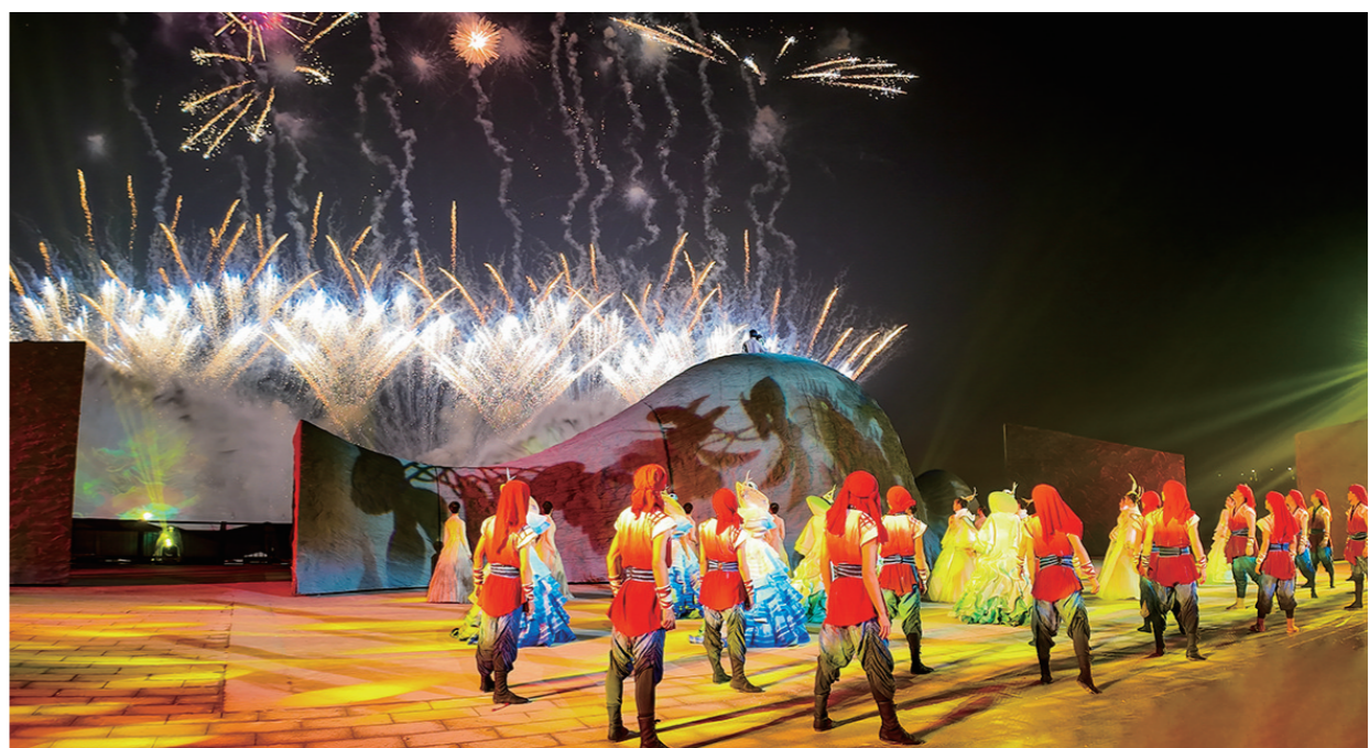
烟花、瓷器、舞台, 实景剧让人耳目一新。