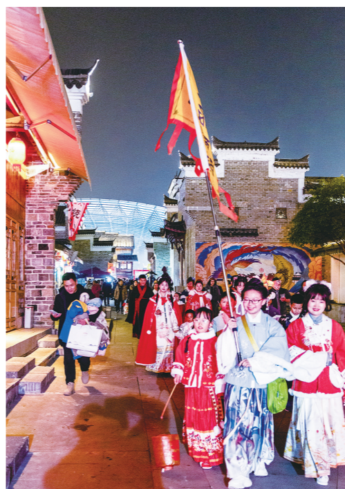
汉服爱好者巡游, 引人注目。

剧场之外的大戏也不遑多让, 炒粉、酱板鸭、瓷器、景点等费用不是免费就是半价, 达到一定粉丝量连星级酒店都免费住。当晚的醴陵城, 哪哪都是水泄不通, 在摩肩接踵的人海中, 一群穿着汉服巡游的帅哥美女格外引人注目, 绿江书院、醴陵门、瓷器口、捡瓷人流中都有他们的古风吹拂。这群从唐诗宋词款款而来的中国风, 为这座千年古城, 为整个跨年引流活动平添一抹亮色。