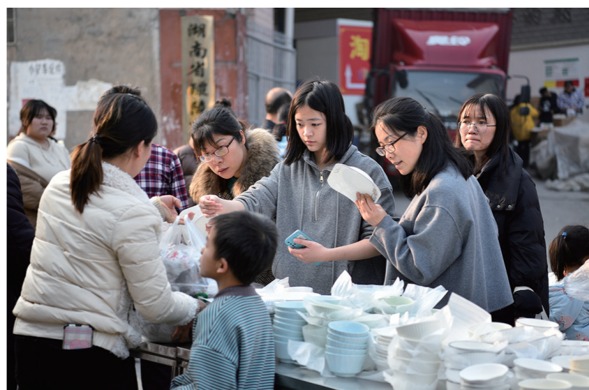
醴陵「捡」瓷活动, 已成引流好方式。