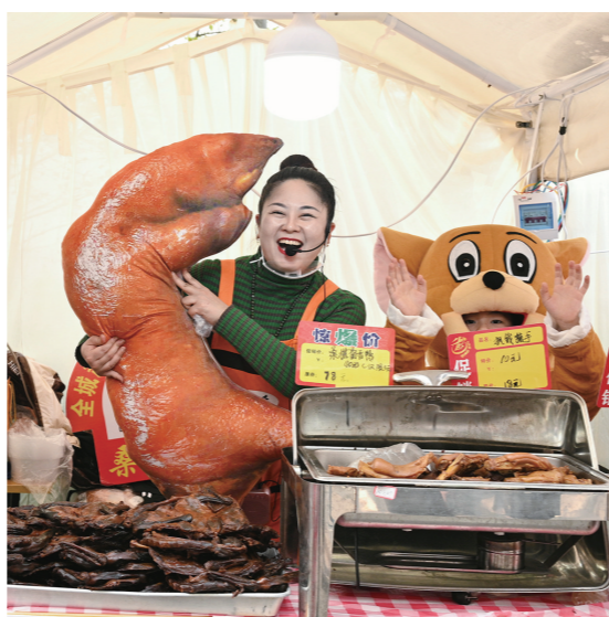
美食街上, 摊主拿着巨型猪蹄造势。