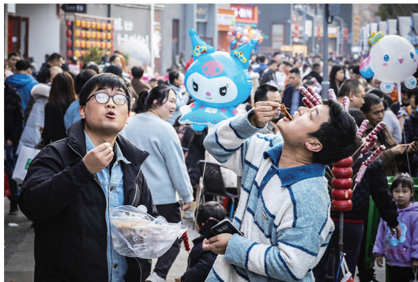
逛景点, 尝美食, 人们流连忘返。