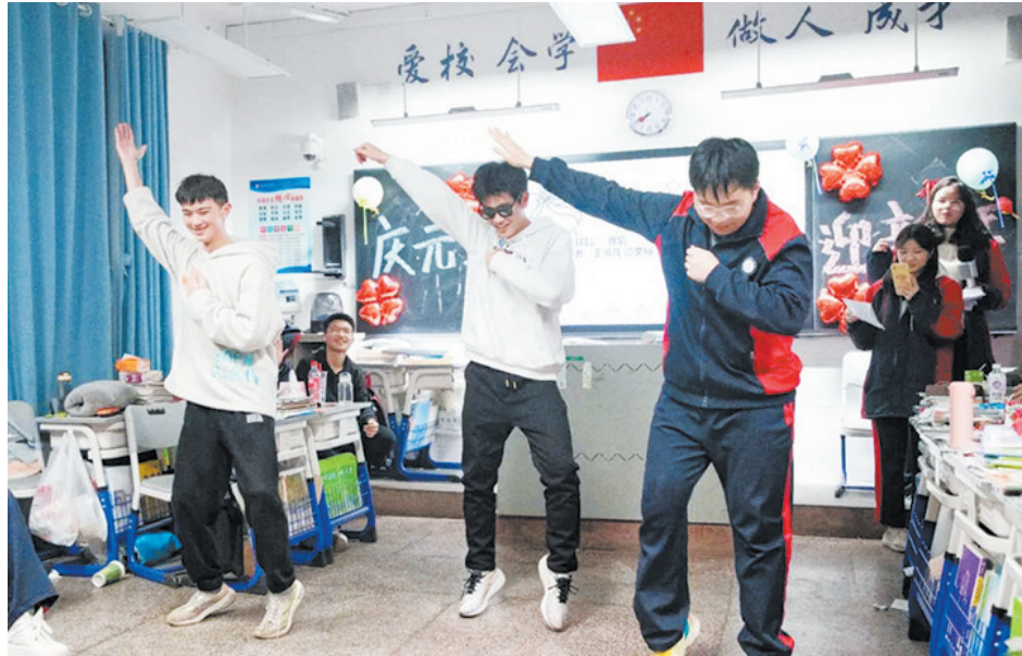
株洲八中班级元旦晚会，学生表演“科目三”放松心情。

虽然没有经过系统的教学，但如今很多孩子都能扭上几段网红舞蹈“科目三”。最近，有不少家长发现了孩子的这项“新技能”。有的家长认为很有趣，能让孩子放松心情动起来。也有家长认为，这类舞蹈没有美感，还容易受伤，制止孩子模仿。