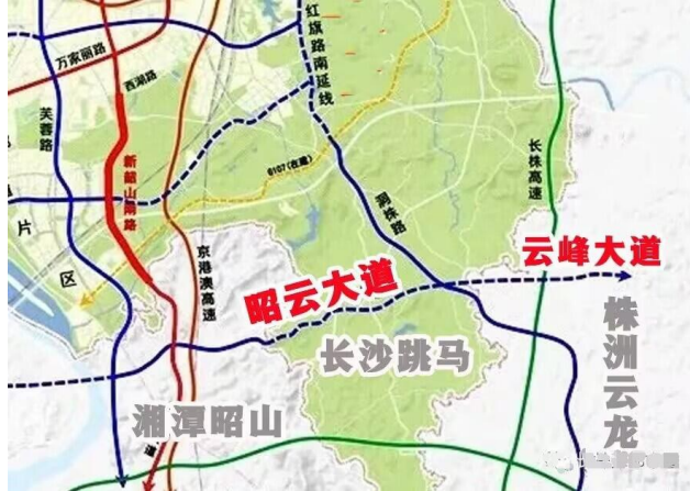
长株潭部分融城干道示意图。

本报讯(株洲晚报融媒体中心/陈正明) 长株潭一体化，交通要先行。根据相关部署，今年长株潭三市将开工建设株洲新马南路—湘潭云龙东路、长沙昭云大道—株洲云峰大道等5条融城干道。1月3日，记者获悉了与株洲直接相关的3条干道建设进展情况。